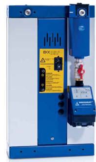
Montaje en la parte trasera