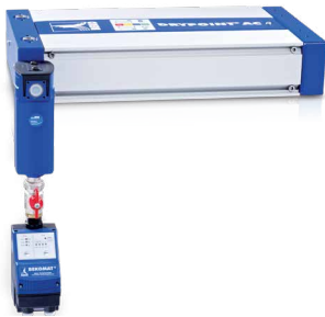
Posibilidad de montaje en horizontal

en horizontal como en vertical, con lo que existen un total de 20 posibilidades de montaje distintas. El sistema multivoltaje, multivoltaje del DRYPOINT® AC 119 – AC 196 permite conectar directamente a todas las redes de alimentación de corriente habituales, con lo que es idóneo para su uso en todo el mundo.