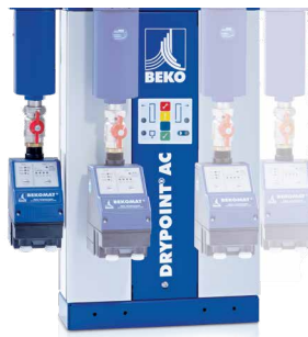
Montaje lateral y en la parte delantera