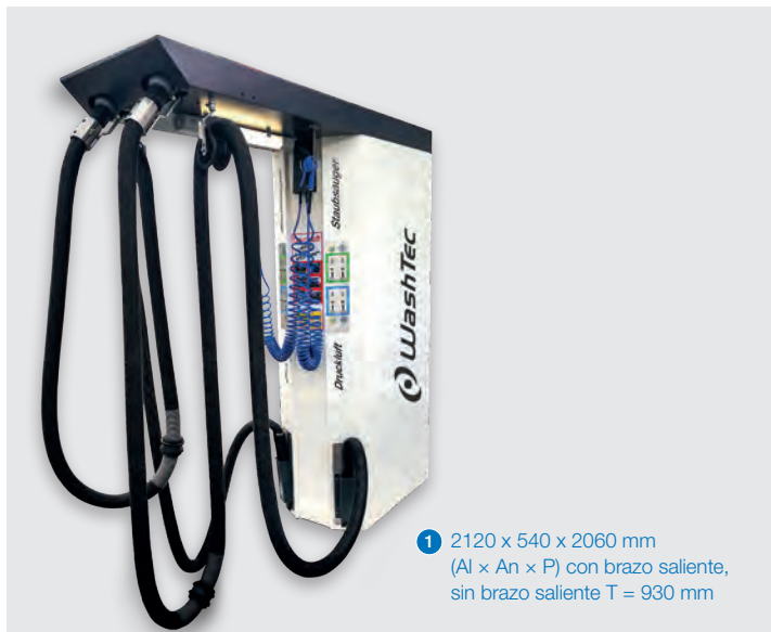
1 2120 x 540 x 2060 mm (Al x An x P) con brazo saliente, sin brazo saliente T = 930 mm