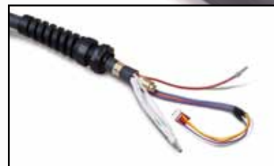
Cables y mangueras de antorcha manual o mecanizada sin desconexión rápida para sistemas CE Powermax600.