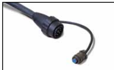
Cables y mangueras de antorcha mecanizada con desconexión rápida.