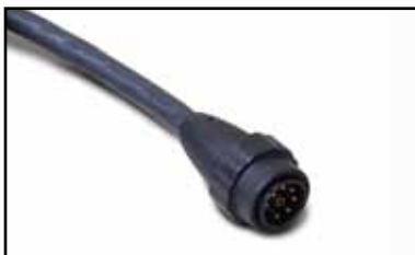
Cables y mangueras de antorcha manual con desconexión rápida.

Las antorchas modernizadas Duramax se venden con o sin desconexión rápida para hacer más fácil la modernización.