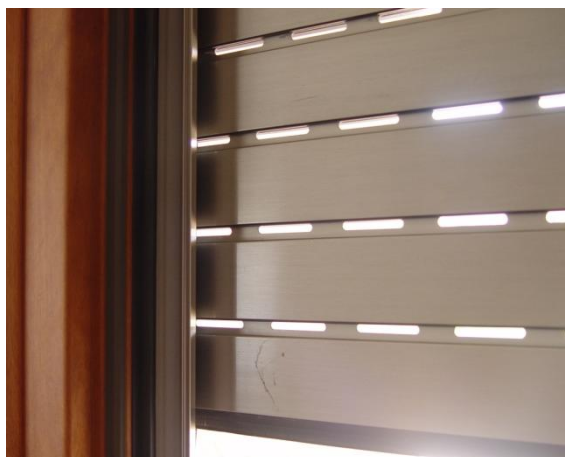
Detalle de los troqueles de luz / ventilación