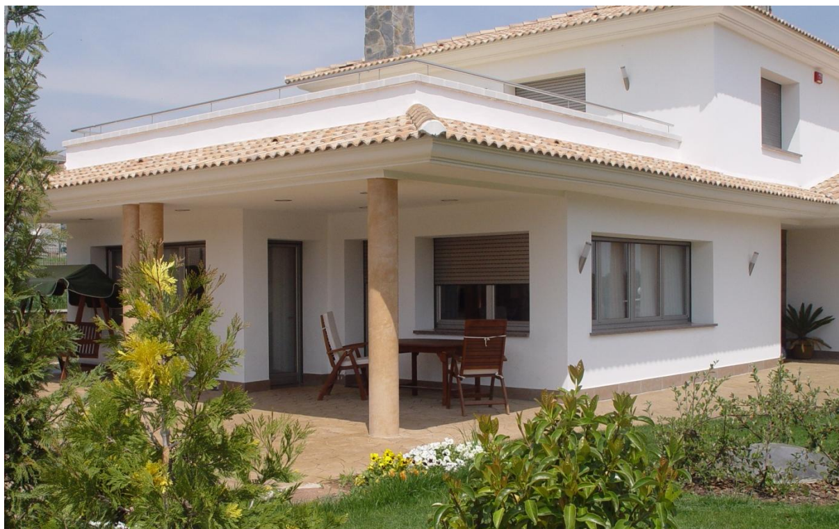
Mod. SILENCE 45-R anodizada Inox Lij+Rep