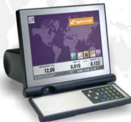
Terminal con pantalla táctil