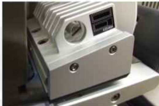
El pulsador de alto rendimiento garantiza una exacta calidad de impresión a alta velocidad.