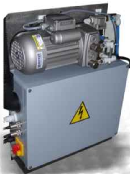
La unidad de control de ES 9100 se adapta a cualquier lugar.