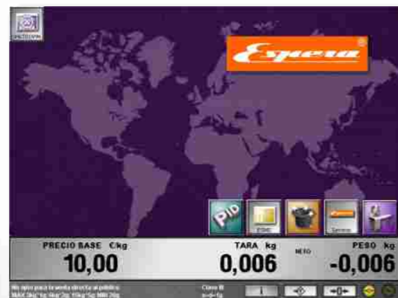
Gestión Interactiva con pantalla táctil.