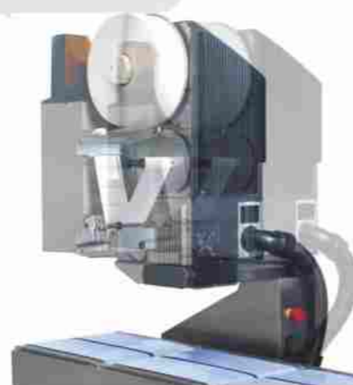
Posicionamiento transversal de la impresora, incluido en programa de paquetes.