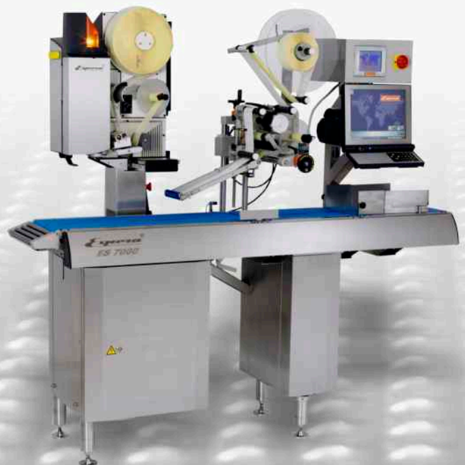
ES 1101 PN Integrada en un equipo de peso-precio Espera