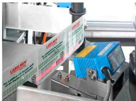
Sensor para la supervisión de los códigos de barras impresos.