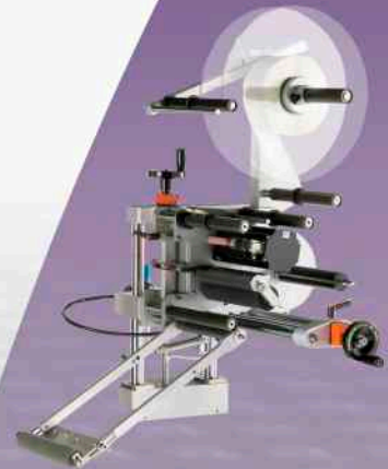
Opción: Dispensador neumático