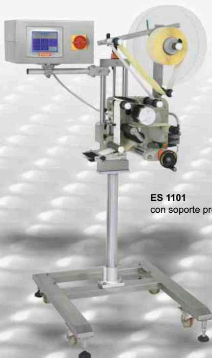
ES 1101 con soporte propio

Ya sea como un equipo adjunto a una máquina de envasado o como un dispositivo con soporte propio en una línea de producción - estos sistemas impresionan por su flexibilidad, por su facilidad de manejo y por sus múltiples aplicaciones diferentes.