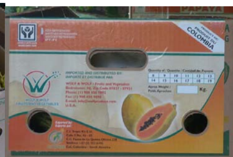
Caja de exportación