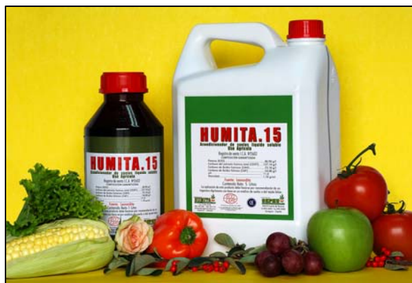
Presentación de "HUMITA-15" en 1 y 5 litros

El primer producto introducido en el mercado de Colombia fue la Enmienda Húmica líquida " HUMITA-15 " fabricada a partir de la Leonardita producida en nuestras propias minas ubicadas en la región de ARAGÓN (España).