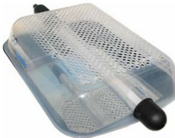
"Tutastop" – Trampa para captura y control de la "Tuta absoluta"

"Tutastop" consiste en un recipiente que contiene un espejo alojado en el interior y en el que se vierte un compuesto de base acuosa que permite capturar y hundir a los insectos. Encima se coloca una cubierta perforada y que contiene el foco de luminosidad e intensidad específica cuya función es doble; de un lado, permitir el paso del insecto que nos interesa evitando capturar insectos beneficiosos y de otro, impedir que las tutas que entran puedan salir