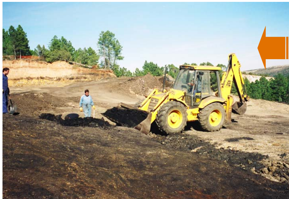
EXTRACCIÓN DE LEONARDITA EN MINA "MARIAN" Teruel, España

La Leonardita aporta especialmente ácidos húmicos, algo de ácidos fúlvicos y toda la gama de micro elementos y silicio esenciales para corregir suelos pobres, agotados, salinos y/o bloqueados, y a su vez es la responsable de formar los complejos arcillo-húmicos, aumentar la C.I.C., reducir la salinidad y la conductividad eléctrica, y su poder quelatante ayuda a desbloquear y asimilar los macro y micro elementos.