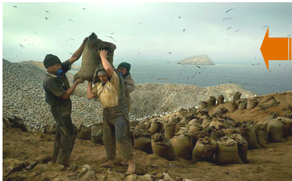
EXTRACCIÓN DEL GUANO DE LAS ISLAS Islas de Perú