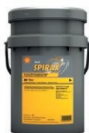
Shell Spirax S4 TXM