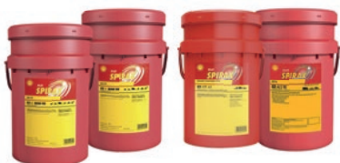
Shell Spirax S2 A 80W-90/85W-140 Shell Spirax S2 ATF AX/ALS 90 Shell Spirax S4 CX 50