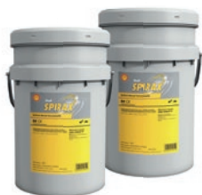
Shell Spirax S4 CX 10W Shell Spirax S4 CX 30