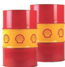
Shell Hydraulic S1 M 46/M 68

Este acuerdo supone otro espaldarazo a la política Blumaq de ofrecer siempre los mejores productos a sus clientes.