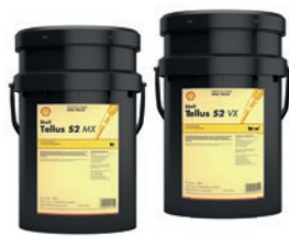
Shell Tellus S2 MX 46/MX 68 Shell Tellus S2 VX 46/VX 68