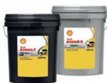
Shell Rimula R3 Turbo 15W-40 Shell Rimula R4 L 15W-40

SHELL® es una marca comercial registrada por su propietario.