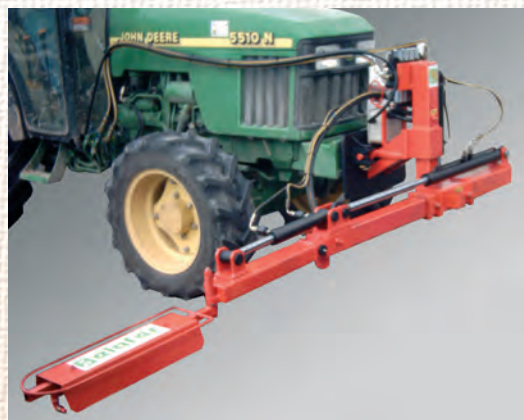
PANTALLA HERBICIDA Acoplable al cepillo con muelle de retroceso.

Barra de corte lateral de 1,80 m. - Fresadora inter-árboles de 0,50 m.