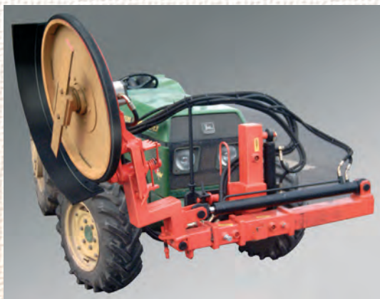
DISCO DESBROZADOR DE 70 CM. El disco inter-árboles de cuchillas, permite un desherbado rápido y seguro.