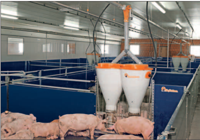
Las secciones de puerta facilitan el alojamiento y desalojo de los animales