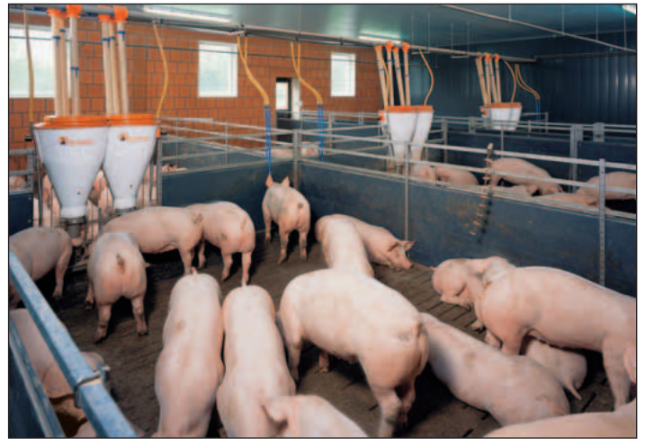
Vista de un corral para gran grupo al final del engorde con PigNic-Jumbo