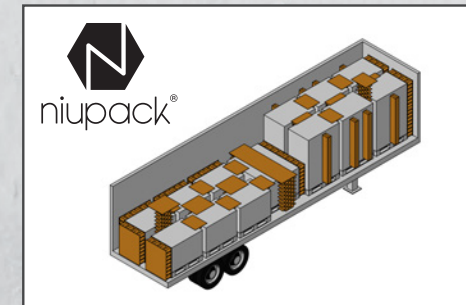
TIPOS DE NIUPACK