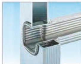
Peldaños embutidos con doble borde interno y externo