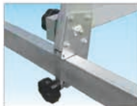
Fijación de la escalera ajustable para montaje en apoyo