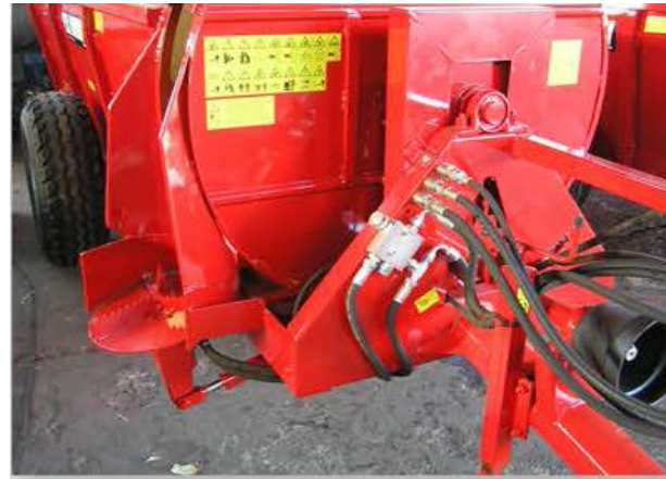
Válvula de control de velocidad.