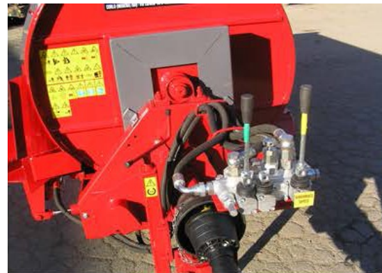
Circuito de aceite independiente con bomba y tanque de aceite.