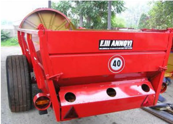
Kit de luces.