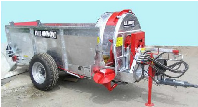
Galvanización en caliente del bastidor completo (excepto piezas móviles).