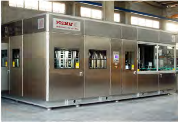
Modelo de posicionador MONOCHUTE-40 con sistema de cambio de formato POSIFLEX , BTU* incorporada en monoblock y cabina de acero inoxidable.

Los posicionadores de alta velocidad MONOCHUTE POSIMAT llevan una cabina con una estructura tubular de acero inoxidable y paneles en acero plastificado galvanizado (opcionalmente los paneles pueden ser en acero inoxidable). El diseño de la cabina, insonorizada y cerrada, permite un continuo control visual de la máquina a través de sus ventanas, mientras las puertas laterales permiten el acceso para la limpieza así como para un rápido control de los mecanismos internos. La parte superior de la máquina está equipada con cubierta para reducir el nivel sonoro así como para evitar el acceso al interior de la máquina mientras ésta está funcionando.