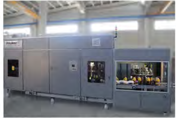
Modelo de posicionador MONOCHUTE-45 con sistema de cambio de formato POSIFLEX y Orientador Rotativo incorporado en monoblock.