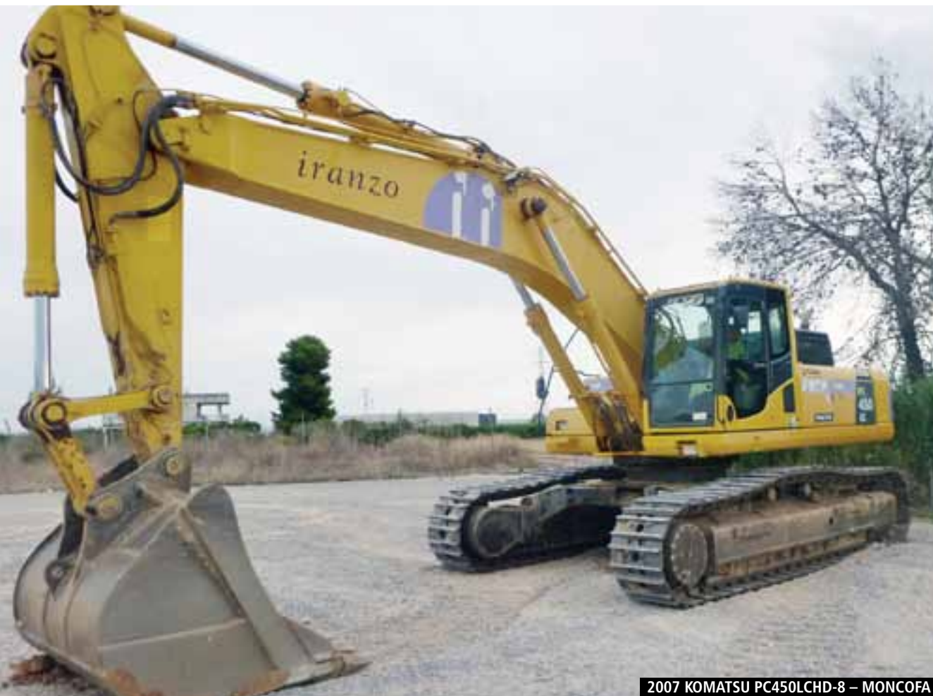
2007 KOMATSU PC450LCHD-8 – MONCOFA