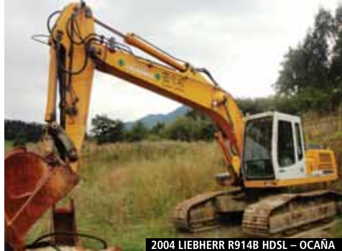
2004 LIEBHERR R914B HDSL – OCAÑA