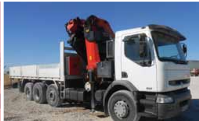
RENAULT PREMIUM 370 8x2 w/ PALFINGER PK72002 – OCAÑA

» OBTENGA LISTAS ACTUALIZADAS EN www.rbauction.es