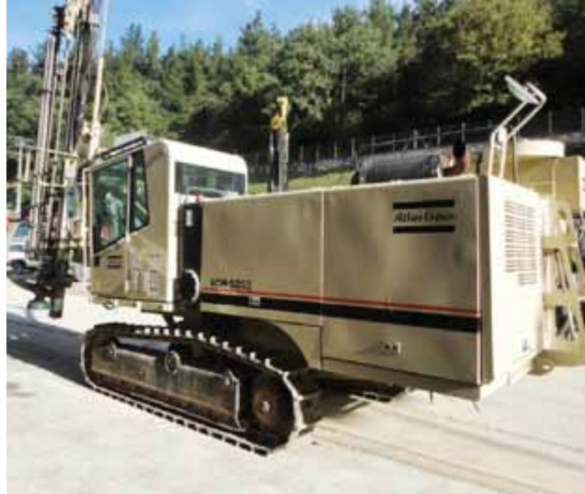
2007 ATLAS COPCO ECM585II – OCAÑA