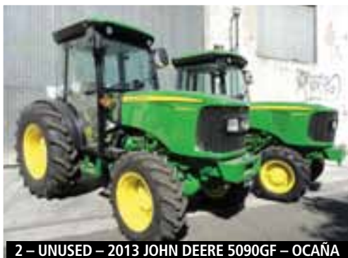
2 – UNUSED – 2013 JOHN DEERE 5090GF – OCAÑA