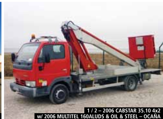
1 / 2 – 2006 CABSTAR 35.10 4x2 w/ 2006 MULTITEL 160ALUDS & OIL & STEEL – OCAÑA