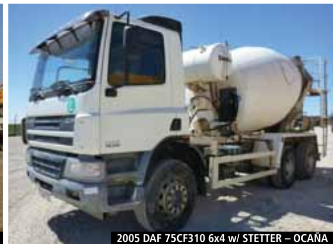
2005 DAF 75CF310 6x4 w/ STETTER – OCAÑA