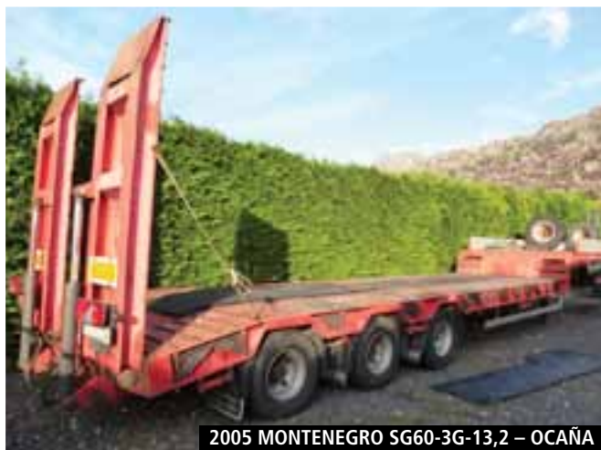
2005 MONTENEGRO SG60-3G-13,2 - OCAÑA