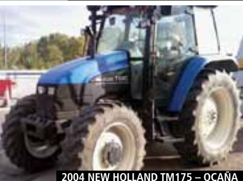
2004 NEW HOLLAND TM175 – OCAÑA