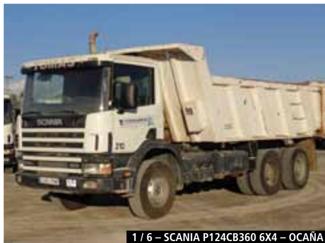
1 / 6 – SCANIA P124CB360 6x4 – OCAÑA