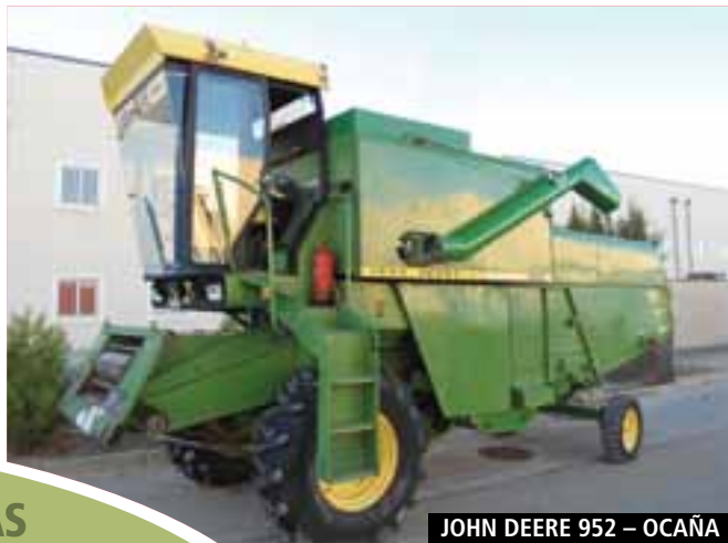
JOHN DEERE 952 - OCAÑA