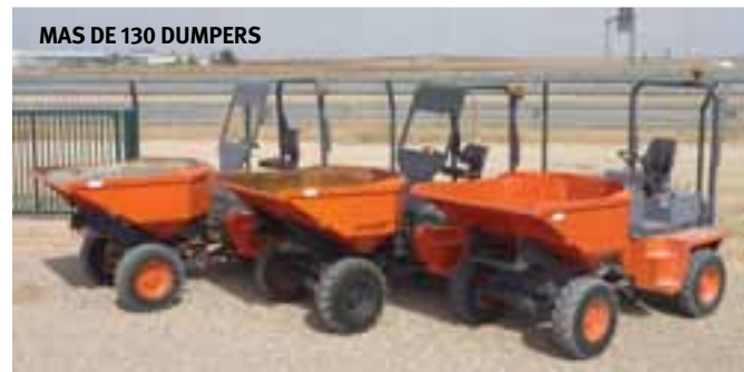
1 / 7 – 2007, 2006 & 2005 AUSA 350AHG 4x4 – OCAÑA & MONCOFA