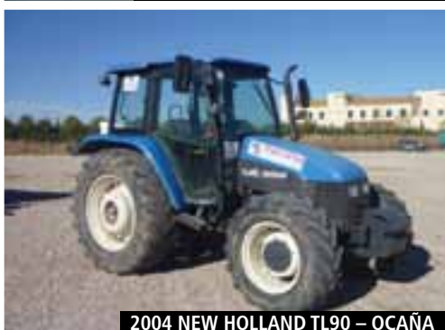
2004 NEW HOLLAND TL90 – OCAÑA