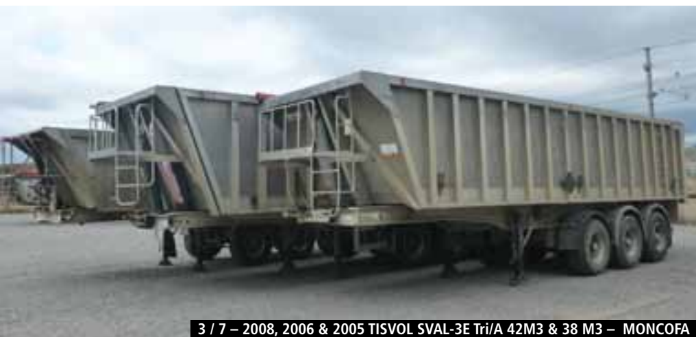
3 / 7 – 2008, 2006 & 2005 TISVOL SVAL-3E Tri/A 42M3 & 38 M3 – MONCOFA