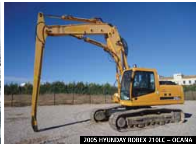
2005 HYUNDAI ROBEX 210LC – OCAÑA