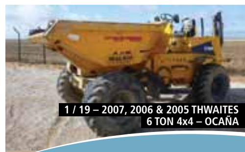
1 / 19 – 2007, 2006 & 2005 THWAITES 6 TON 4x4 – OCAÑA