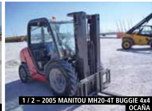
1 / 2 - 2005 MANITOU MH20-4T BUGGIE 4x4 OCAÑA