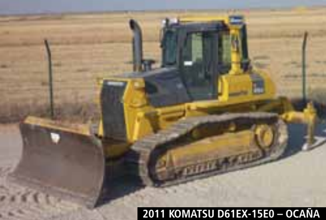
2011 KOMATSU D61EX-15E0 – OCAÑA