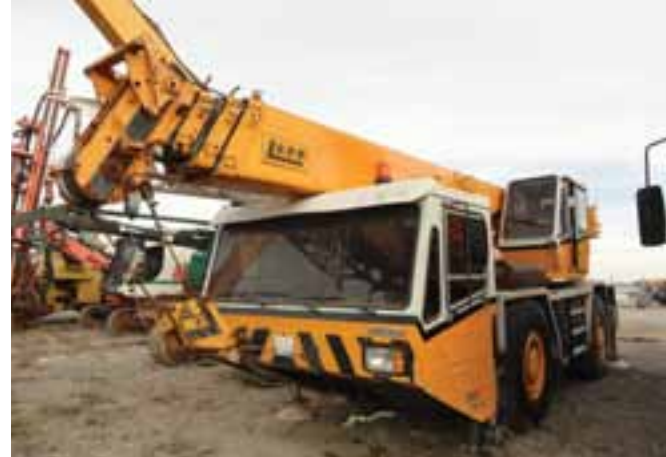
LUNA AT-35-27 4x4x4 – OCAÑA