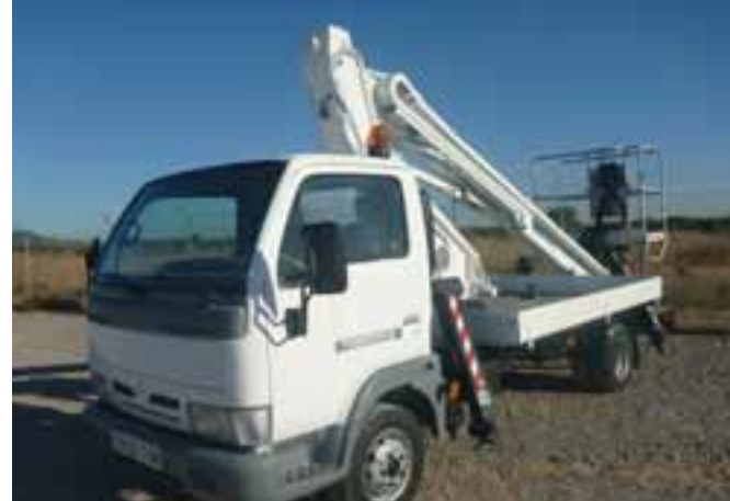
2004 NISSAN CABSTAR TL110 4x2 w/ OIL & STEEL 1490 – MONCOFA