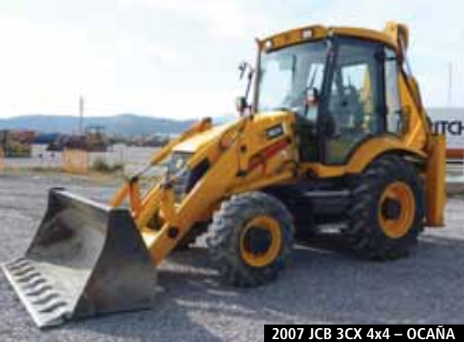
2007 JCB 3CX 4x4 – OCAÑA