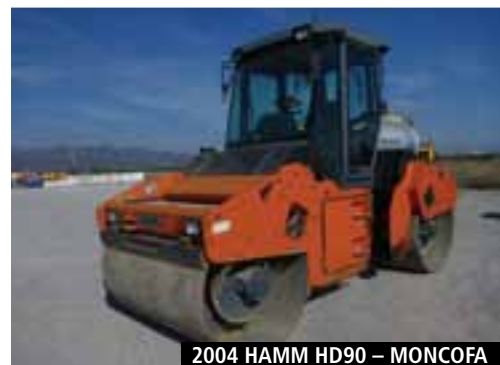
2004 HAMM HD90 – MONCOFA