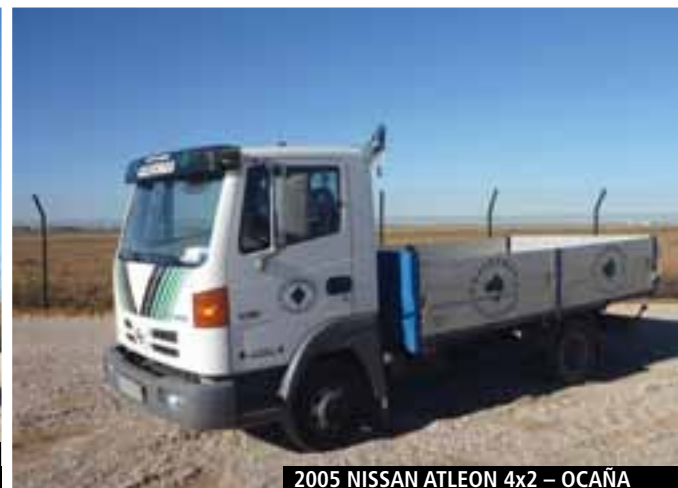
2005 NISSAN ATLEON 4x2 – OCAÑA