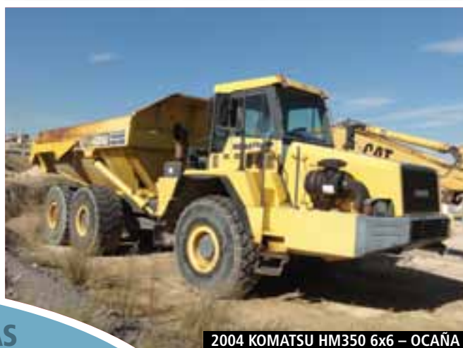
2004 KOMATSU HM350 6x6 – OCAÑA