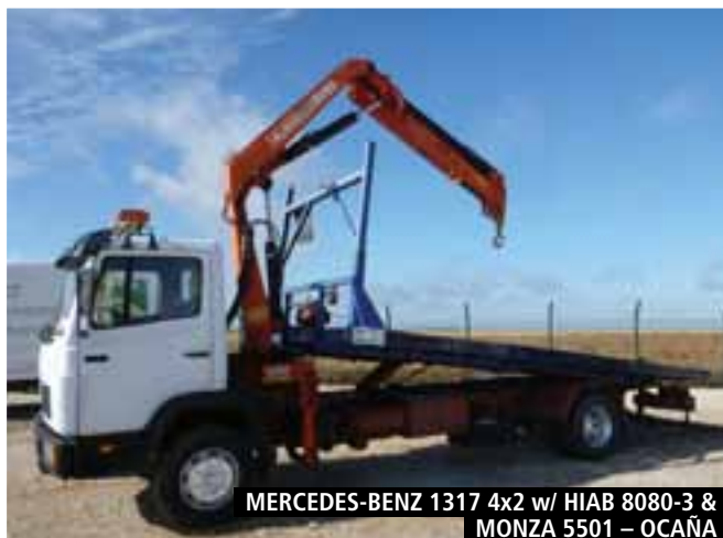
MERCEDES-BENZ 1317 4x2 w/ HIAB 8080-3 & MONZA 5501 – OCAÑA