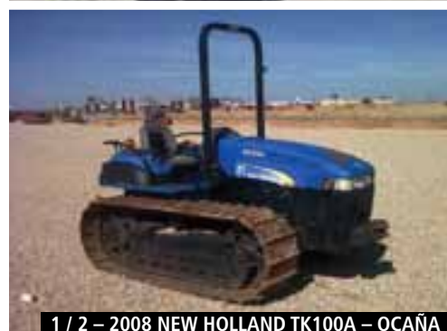
1 / 2 – 2008 NEW HOLLAND TK100A – OCAÑA