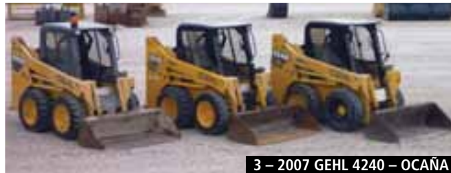
3 – 2007 GEHL 4240 – OCAÑA