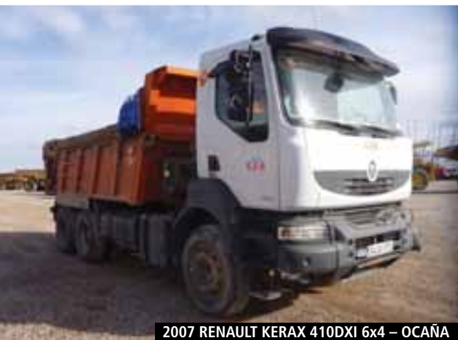
2007 RENAULT KERAX 410DXI 6x4 – OCAÑA