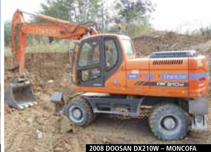
2008 DOOSAN DX210W – MONCOFA