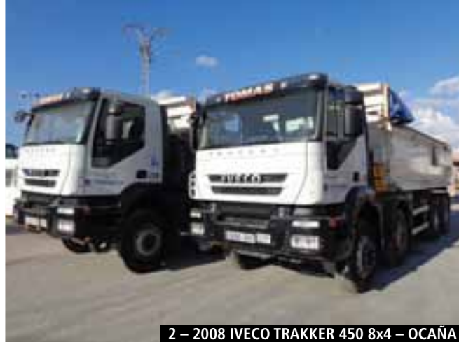
2 – 2008 IVECO TRAKKER 450 8x4 – OCAÑA