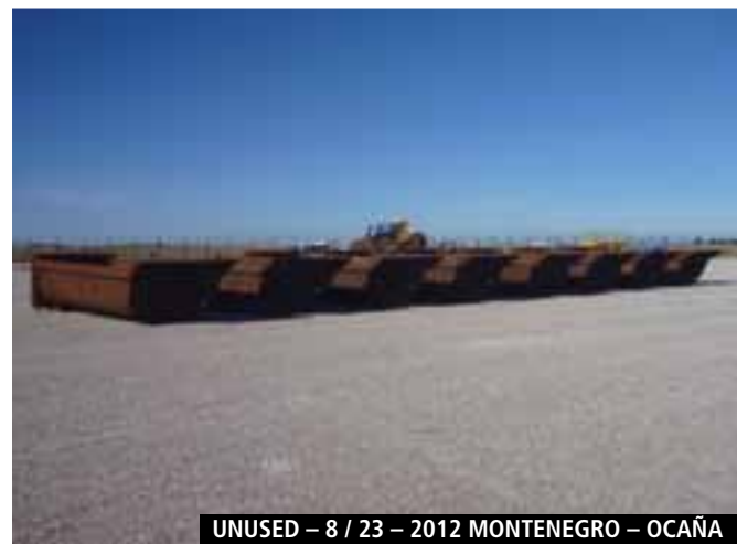
UNUSED - 8 / 23 - 2012 MONTENEGRO - OCAÑA