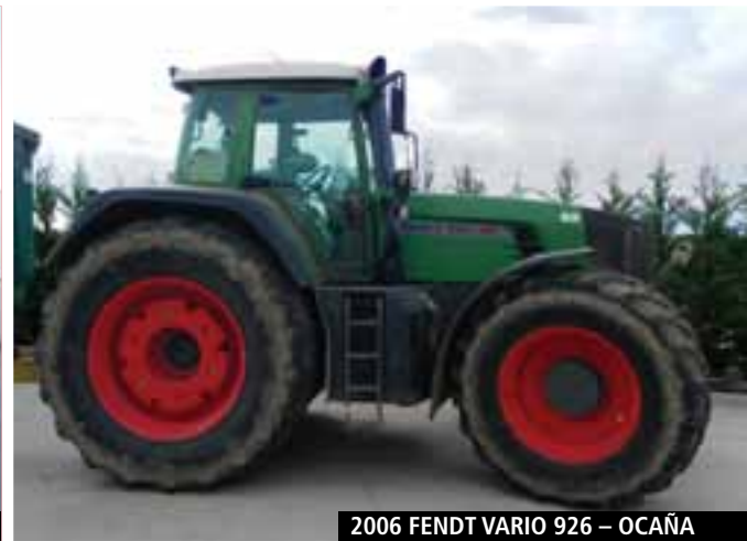
2006 FENDT VARIO 926 - OCAÑA

» OBTENGA LISTAS ACTUALIZADAS EN www.rbauction.es