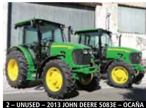
2 – UNUSED – 2013 JOHN DEERE 5083E – OCAÑA