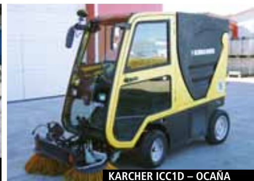
KARCHER ICC1D – OCAÑA