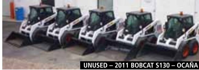
UNUSED – 2011 BOBCAT S130 – OCAÑA