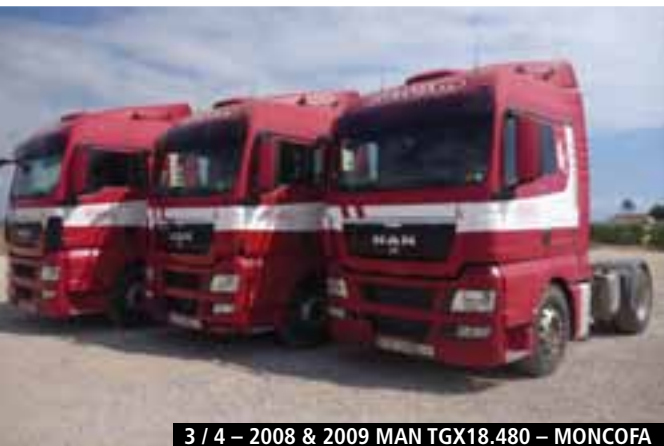
3 / 4 – 2008 & 2009 MAN TGX18.480 – MONCOFA