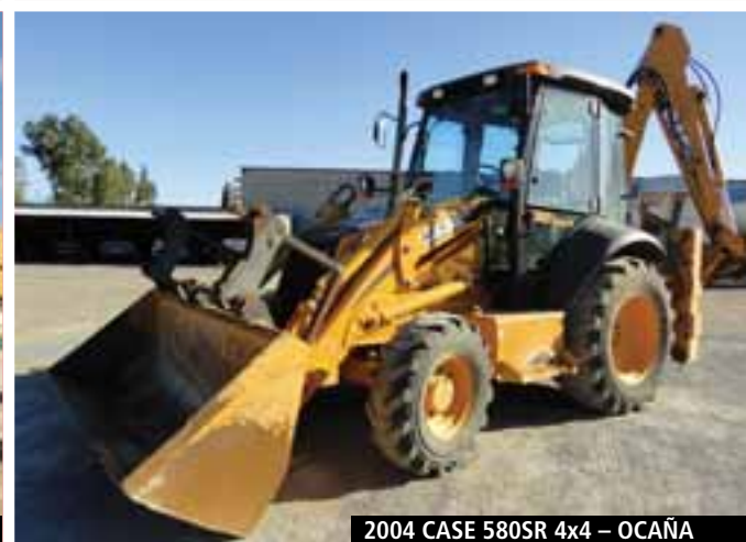
2004 CASE 580SR 4x4 – OCAÑA

» OBTENGA LISTAS ACTUALIZADAS EN www.rbauction.es