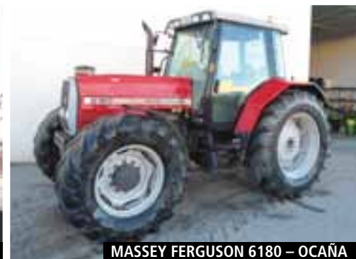
MASSEY FERGUSON 6180 – OCAÑA