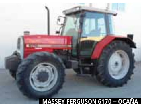
MASSEY FERGUSON 6170 – OCAÑA