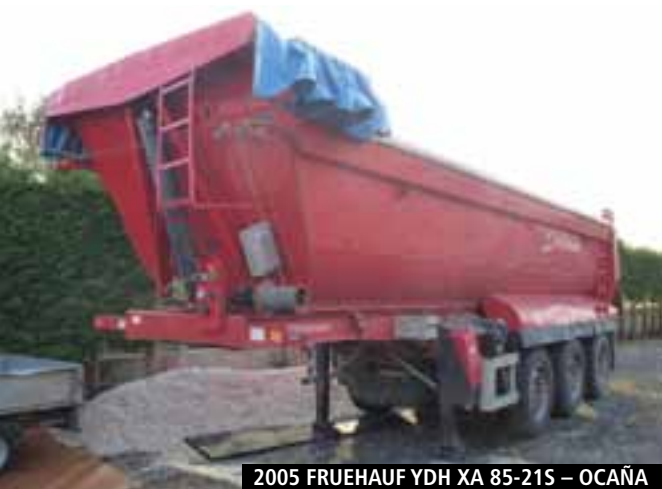
2005 FRUEHAUF YDH XA 85-21S – OCAÑA