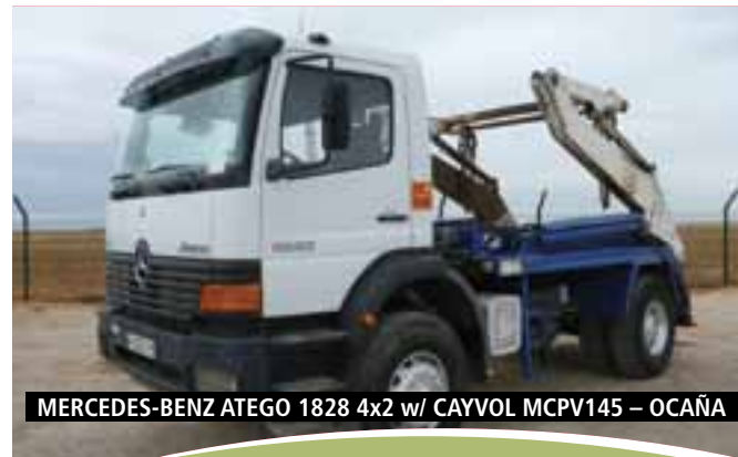
MERCEDES-BENZ ATEGO 1828 4x2 w/ CAYVOL MCPV145 – OCAÑA