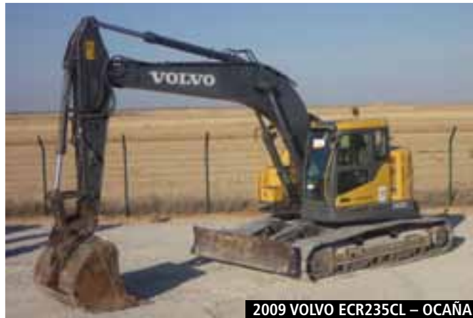
2009 VOLVO ECR235CL – OCAÑA