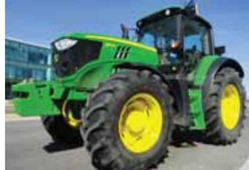
2 – UNUSED – 2013 JOHN DEERE 6150M – OCAÑA