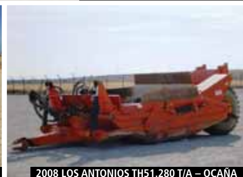
2008 LOS ANTONIOS TH51.280 T/A – OCAÑA