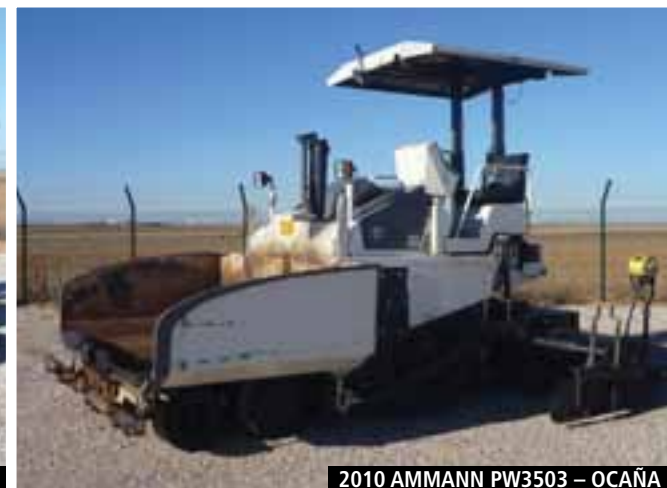
2010 AMMANN PW3503 – OCAÑA