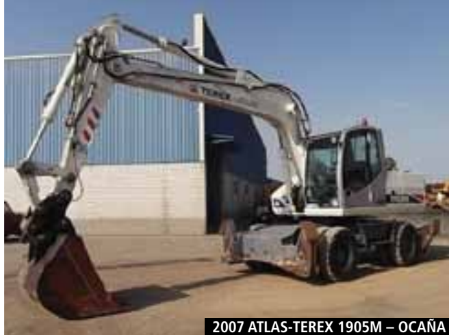
2007 ATLAS-TEREX 1905M – OCAÑA