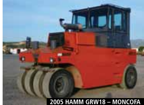
2005 HAMM GRW18 – MONCOFA