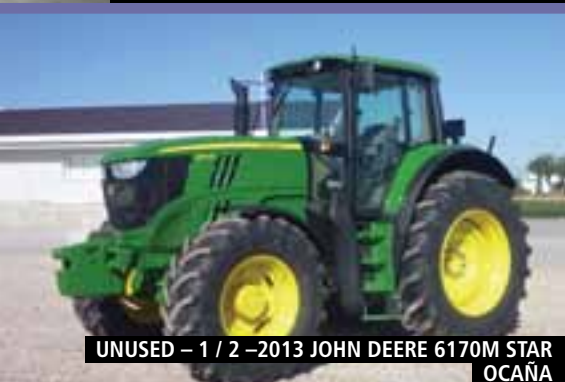
UNUSED – 1 / 2 – 2013 JOHN DEERE 6170M STAR OCAÑA