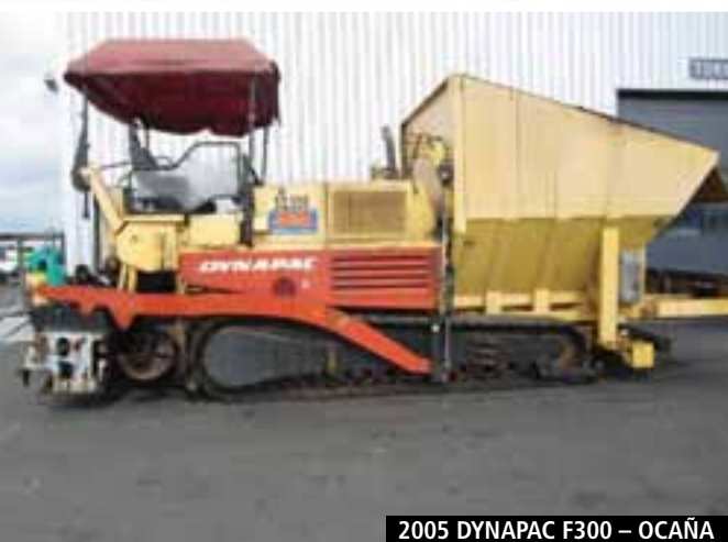
2005 DYNAPAC F300 – OCAÑA