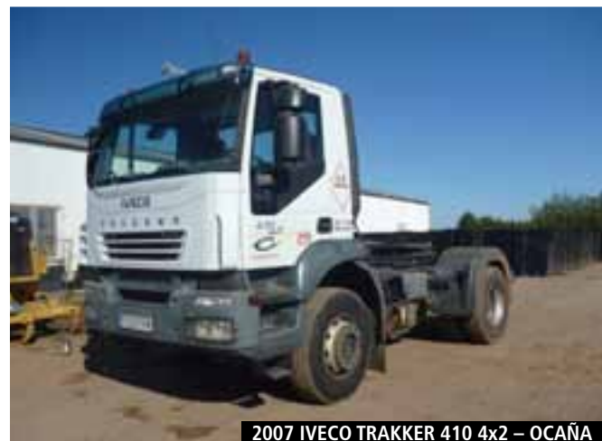
2007 IVECO TRAKKER 410 4x2 – OCAÑA