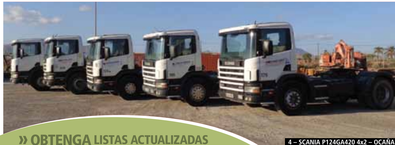
4 – SCANIA P124GA420 4x2 – OCAÑA