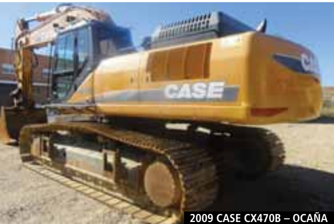
2009 CASE CX470B – OCAÑA