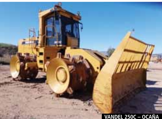
VANDEL 250C – OCAÑA