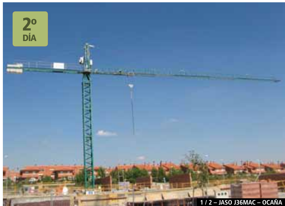
1 / 2 - JASO J36MAC - OCAÑA