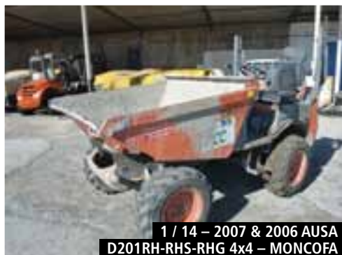
1 / 14 – 2007 & 2006 AUSA D201RH-RHS-RHG 4x4 – MONCOFA