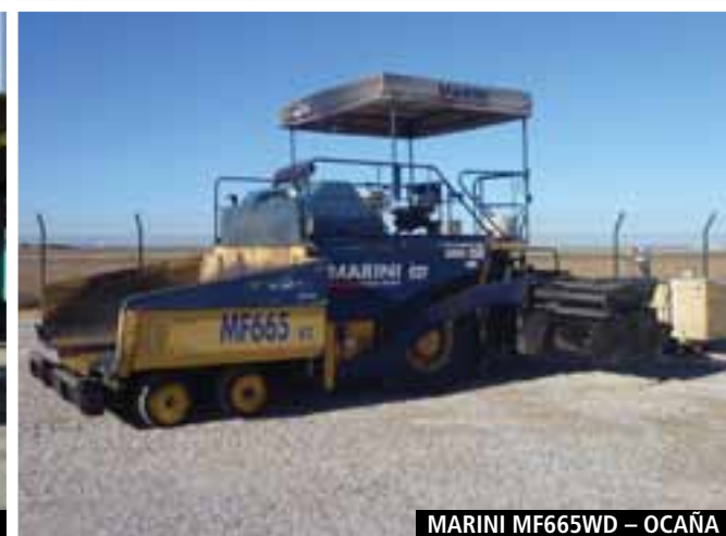
MARINI MF665WD – OCAÑA