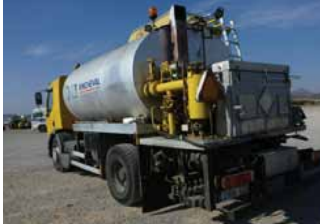
2004 RENAULT 320.18 4x2 w/ 2004 RINCHEVAL 9415L – MONCOFA