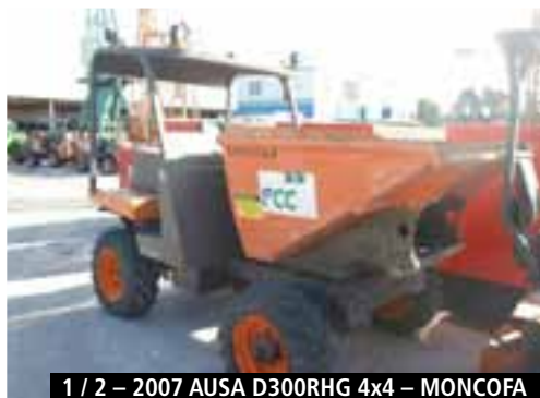
1 / 2 – 2007 AUSA D300RHG 4x4 – MONCOFA