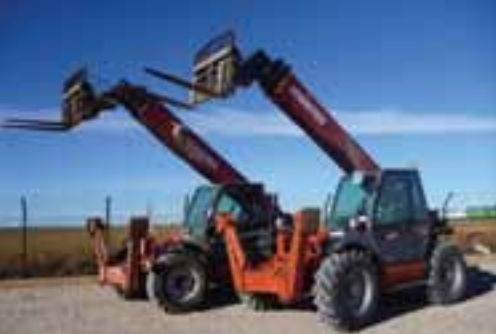
2 - 2006 MANITOU MT1740SLT 4x4 - OCAÑA