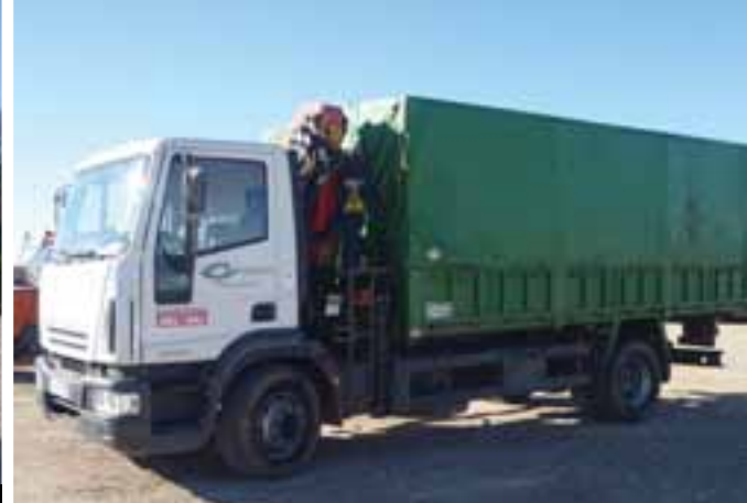
2006 IVECO EUROCARGO 240 4x2 w/ PALFINGER PK9501 – OCAÑA