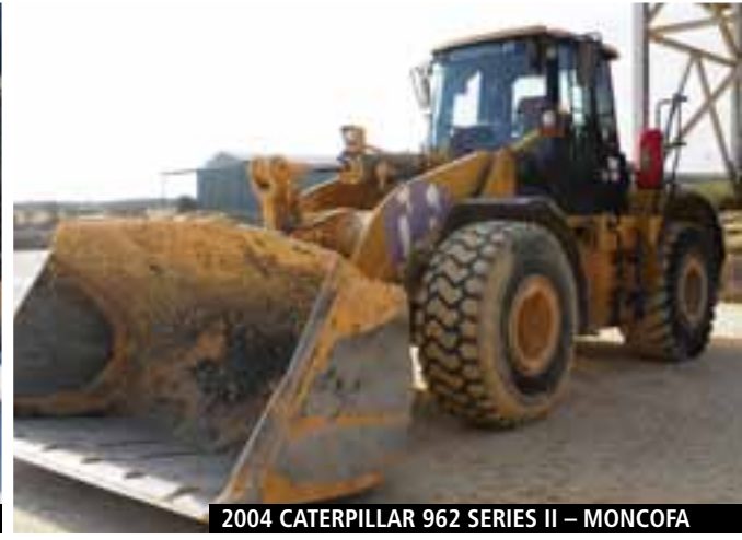
2004 CATERPILLAR 962 SERIES II – MONCOFA