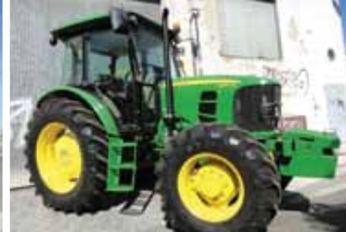
UNUSED – 2012 JOHN DEERE 6130D – OCAÑA