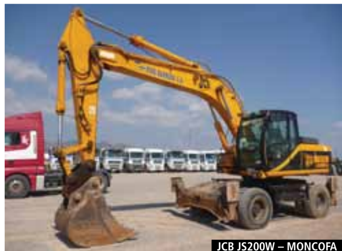
JCB JS200W – MONCOFA