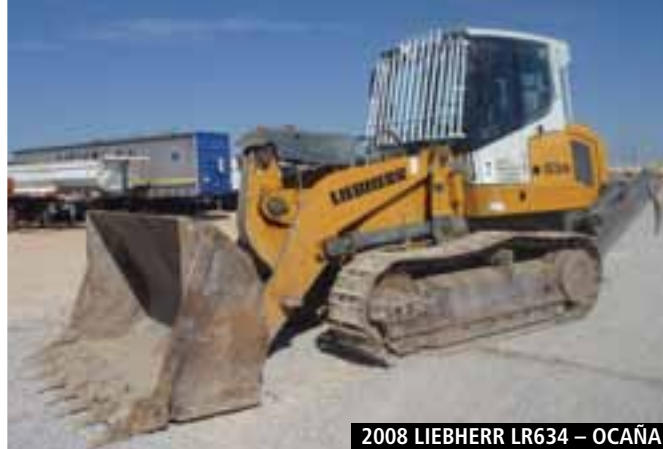
2008 LIEBHERR LR634 – OCAÑA