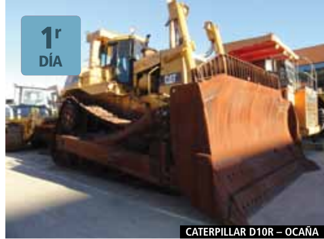
CATERPILLAR D10R – OCAÑA