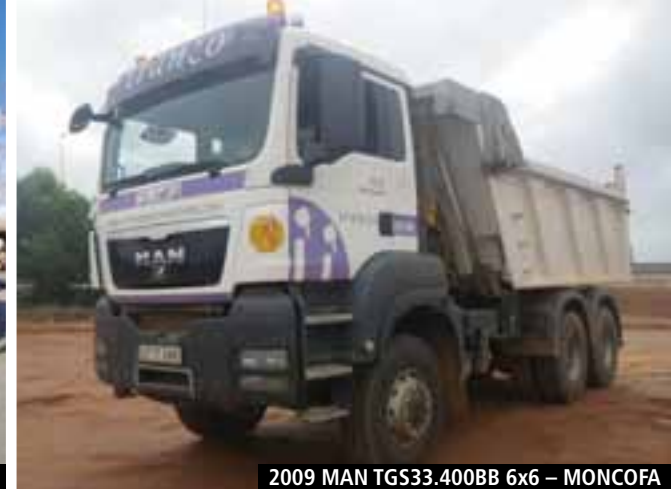
2009 MAN TGS33.400BB 6x6 – MONCOFA