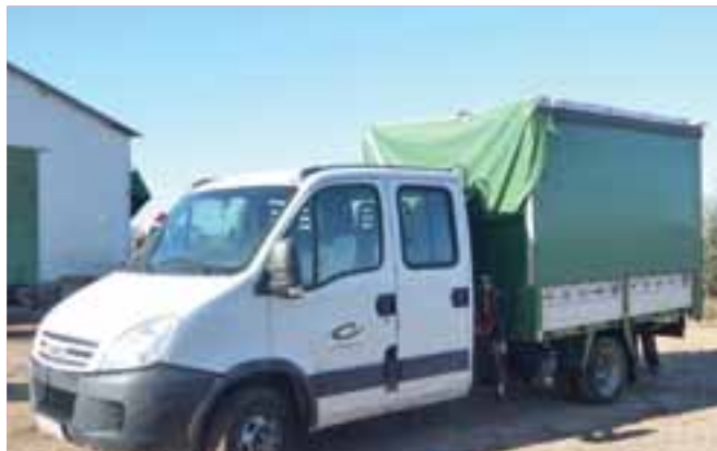
2008 IVECO DAILY 35C15 4x2 w/ 2007 PALFINGER PK2700B – OCAÑA