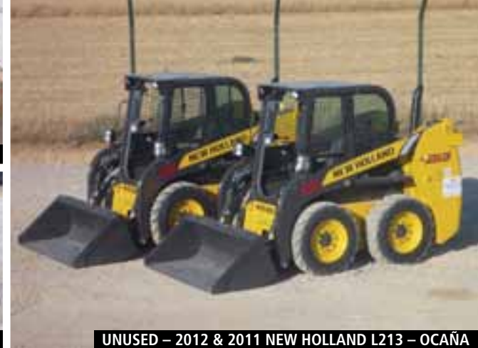
UNUSED – 2012 & 2011 NEW HOLLAND L213 – OCAÑA