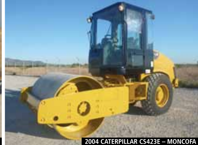
2004 CATERPILLAR CS423E – MONCOFA