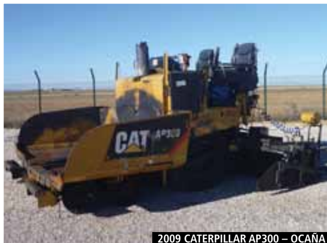
2009 CATERPILLAR AP300 – OCAÑA