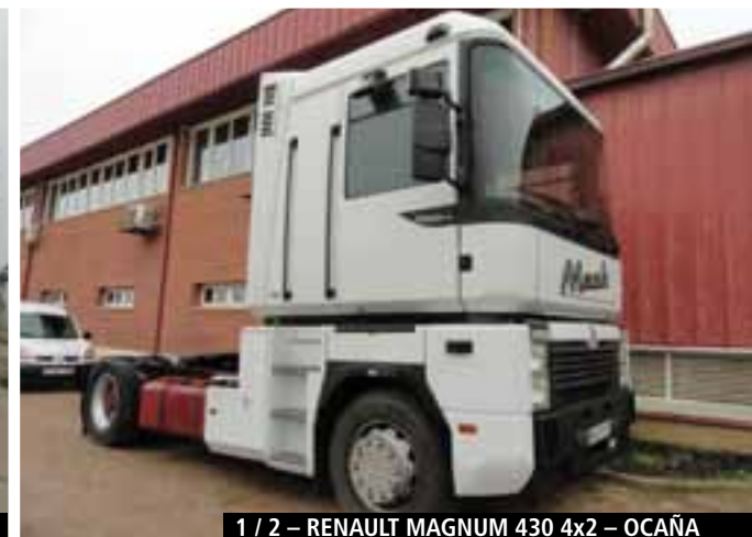
1 / 2 – RENAULT MAGNUM 430 4x2 – OCAÑA