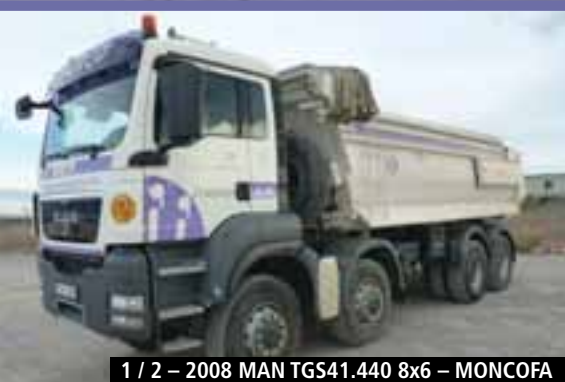
1 / 2 – 2008 MAN TGS41.440 8x6 – MONCOFA