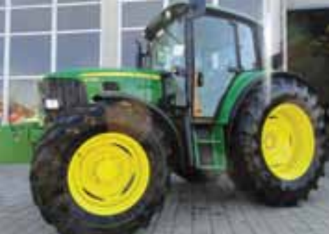
UNUSED – 2013 JOHN DEERE 6330 – OCAÑA