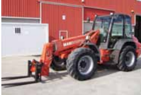
2004 MANITOU MLT628T 4x4 - OCAÑA