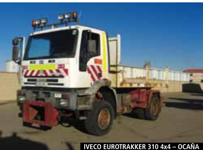
IVECO EUROTRAKKER 310 4x4 – OCAÑA