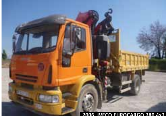
2006 IVECO EUROCARGO 280 4x2 w/ 2006 FASSI F195A.25 – MONCOFA