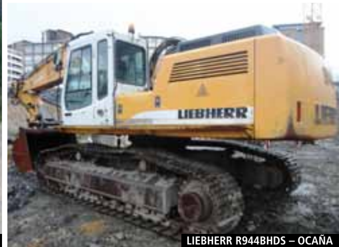
LIEBHERR R944BHDS – OCAÑA