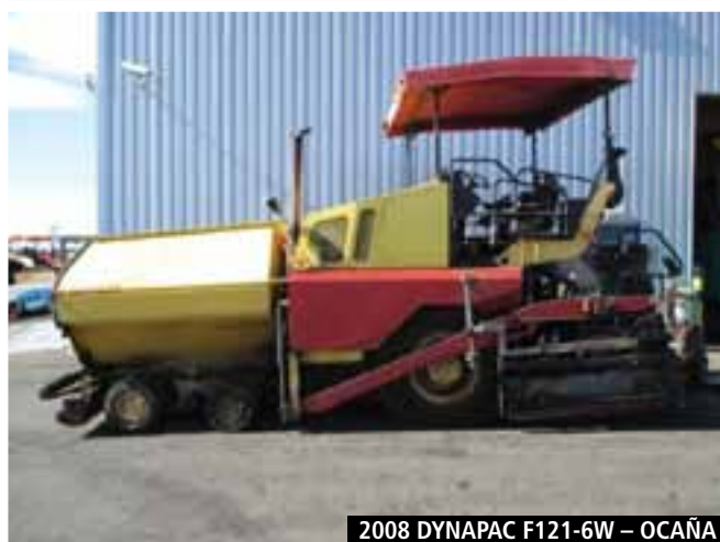
2008 DYNAPAC F121-6W – OCAÑA