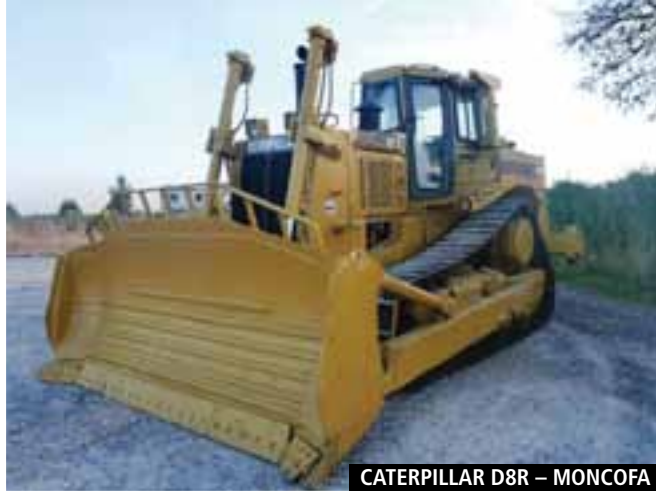
CATERPILLAR D8R – MONCOFA