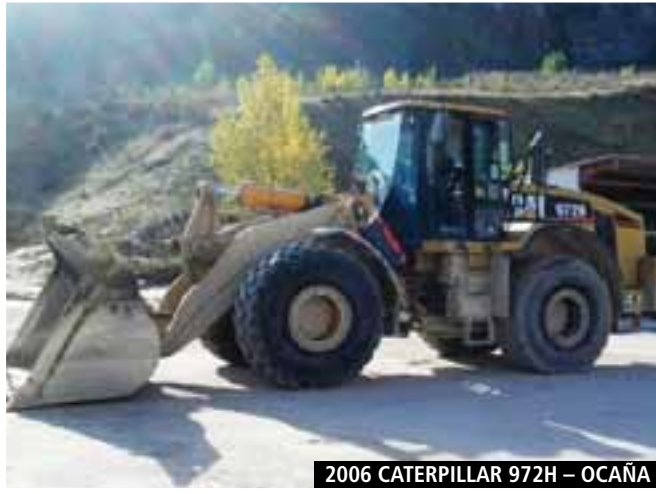
2006 CATERPILLAR 972H – OCAÑA