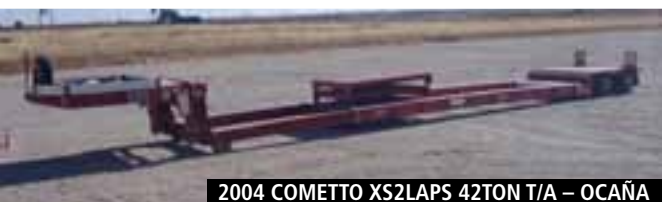
2004 COMETTO XS2LAPS 42TON T/A – OCAÑA