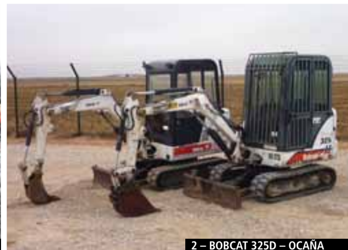
2 – BOBCAT 325D – OCAÑA