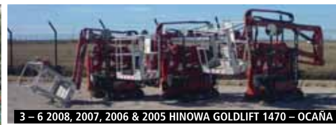
3 – 6 2008, 2007, 2006 & 2005 HINOWA GOLDLIFT 1470 – OCAÑA