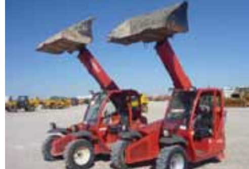
2 - 2008 MANITOU SLT415 - OCAÑA