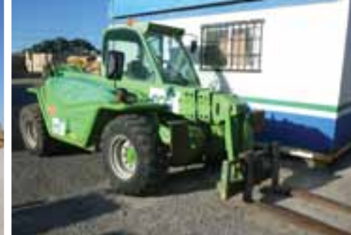
2006 MERLO P38.12 4x4 - MONCOFA