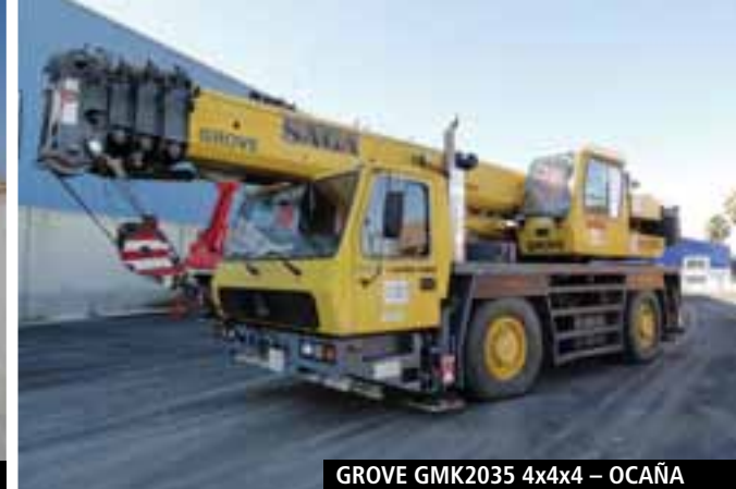
GROVE GMK2035 4x4x4 – OCAÑA