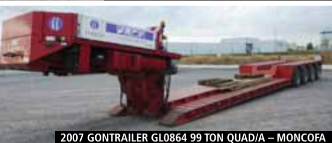
2007 GONTRAILER GL0864 99 TON QUAD/A – MONCOFA