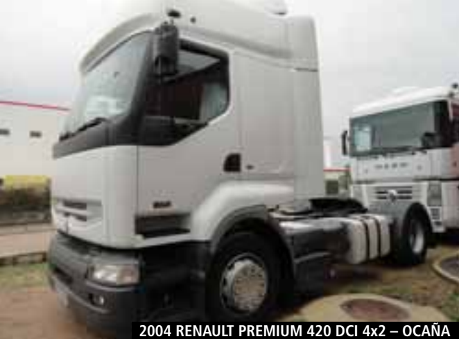
2004 RENAULT PREMIUM 420 DCI 4x2 – OCAÑA