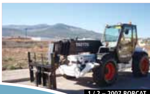
1 / 2 – 2007 BOBCAT T40170 4x4x4 OCAÑA