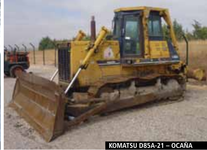
KOMATSU D85A-21 – OCAÑA