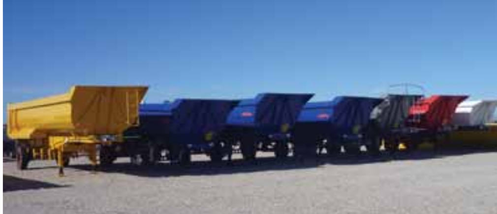
7 / 11 - UNUSED - 2012 MONTENEGRO D1725 & D1706 Tri/A & T/A - OCAÑA