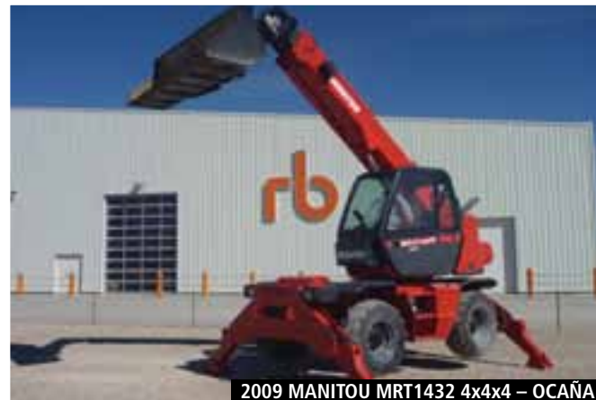
2009 MANITOU MRT1432 4x4x4 – OCAÑA

» Para listas actualizadas del equipo, por favor, visite nuestra página web en www.rbauction.es