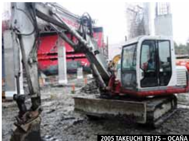
2005 TAKEUCHI TB175 – OCAÑA