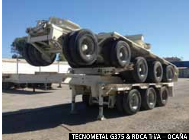
TECNOMETAL G375 & RDCA Tri/A – OCAÑA