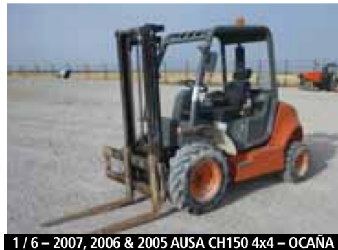
1 / 6 - 2007, 2006 & 2005 AUSA CH150 4x4 - OCAÑA