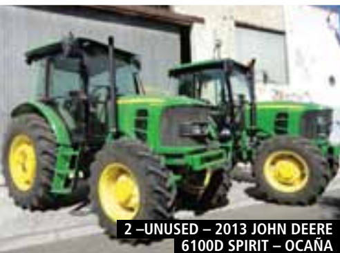
2 – UNUSED – 2013 JOHN DEERE 6100D SPIRIT – OCAÑA