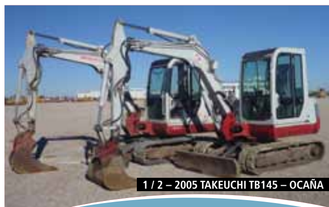
1 / 2 – 2005 TAKEUCHI TB145 – OCAÑA