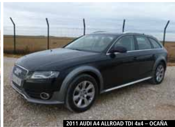
2011 AUDI A4 ALLROAD TDI 4x4 - OCAÑA