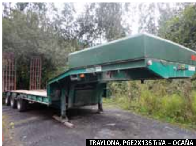
TRAYLONA, PGE2X136 Tri/A – OCAÑA