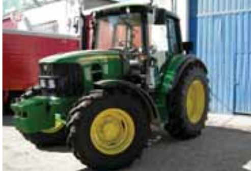
UNUSED – 2013 JOHN DEERE 6230 – OCAÑA