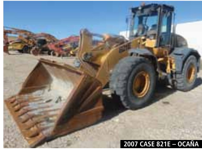
2007 CASE 821E – OCAÑA