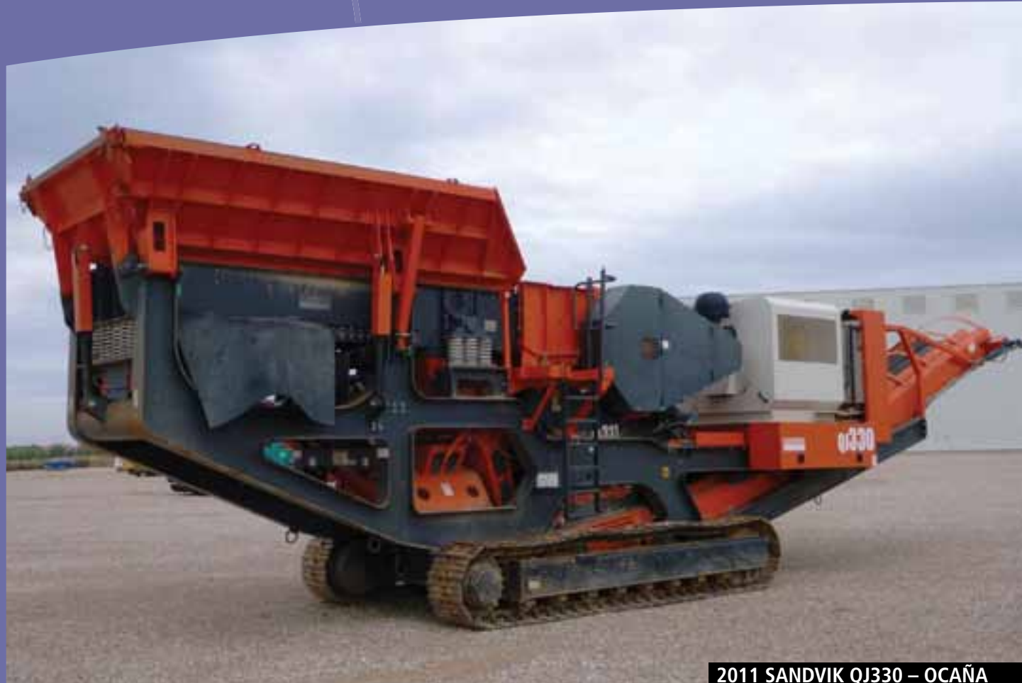
2011 SANDVIK QJ330 – OCAÑA