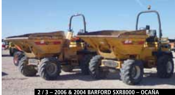
2 / 3 – 2006 & 2004 BARFORD SXR8000 – OCAÑA