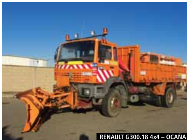
RENAULT G300.18 4x4 – OCAÑA