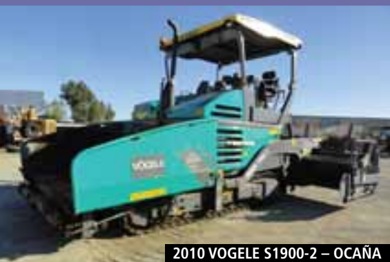
2010 VOGELE S1900-2 – OCAÑA