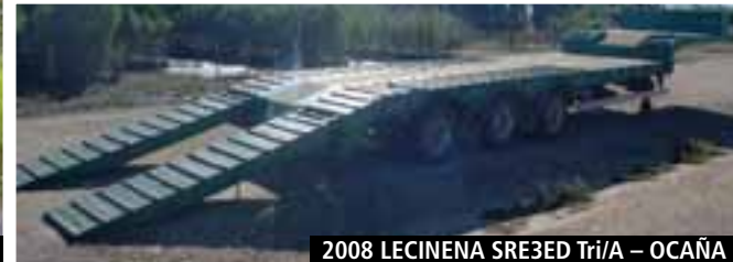
2008 LECINENA SRE3ED Tri/A – OCAÑA