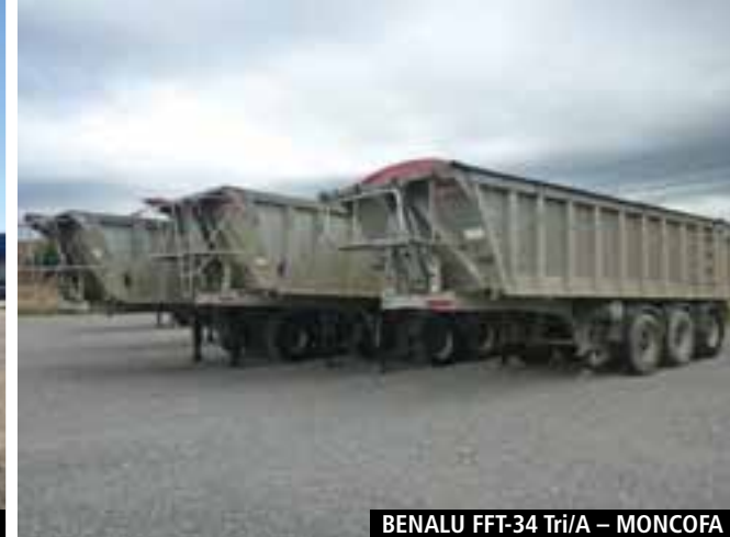
BENALU FFT-34 Tri/A – MONCOFA