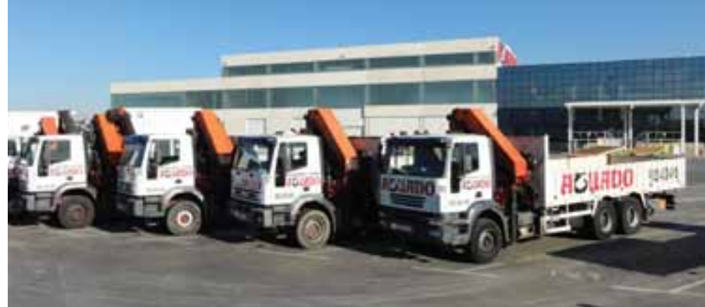
4 - 2006, 2005 & 2004 IVECO TRAKKER & EUROTRAKKER 310 6x4 w/ 2006, 2005 & 2004 PALFINGER PK44002 & PK36002 - OCAÑA