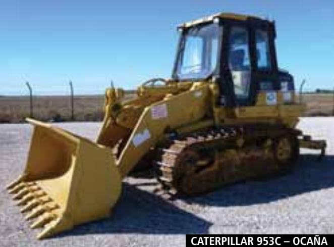
CATERPILLAR 953C – OCAÑA