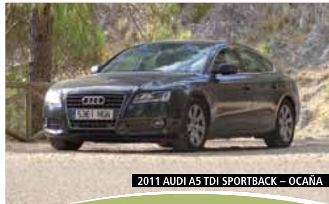
2011 AUDI A5 TDI SPORTBACK - OCAÑA