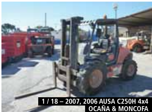
1 / 18 - 2007, 2006 AUSA C250H 4x4 OCAÑA & MONCOFA