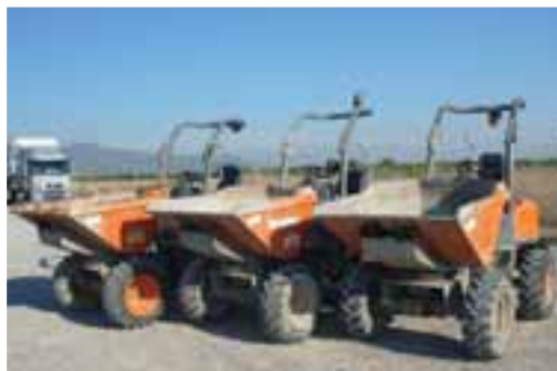
3 – 2005 AUSA D150AHG 4x4 – MONCOFA