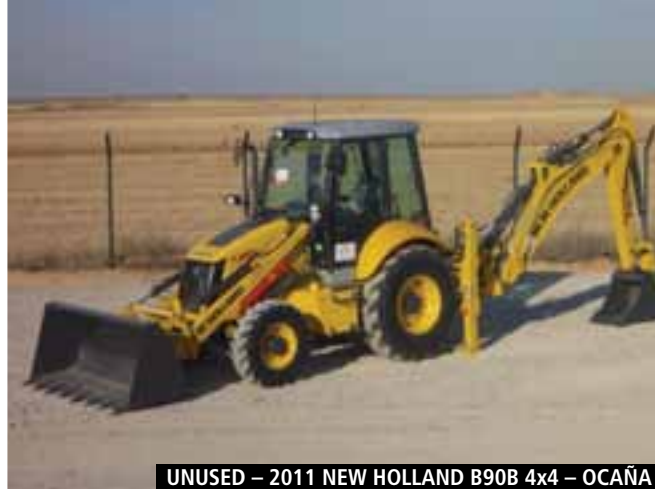
UNUSED – 2011 NEW HOLLAND B90B 4x4 – OCAÑA