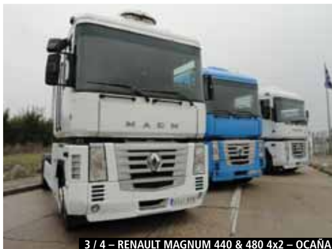
3 / 4 – RENAULT MAGNUM 440 & 480 4x2 – OCAÑA