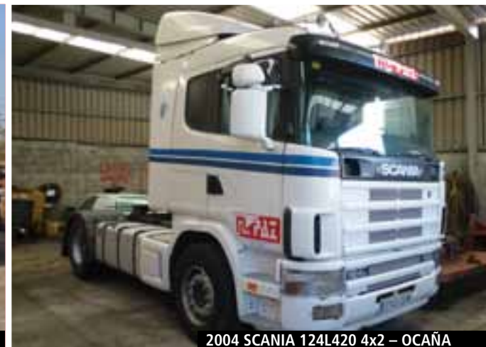
2004 SCANIA 124L420 4x2 – OCAÑA

» OBTENGA LISTAS ACTUALIZADAS EN www.rbauction.es