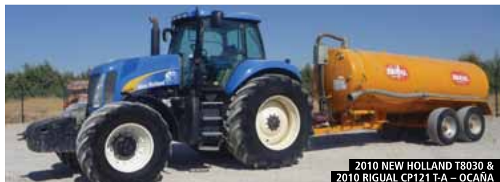
2010 NEW HOLLAND T8030 & 2010 RIGUAL CP121 T-A – OCAÑA