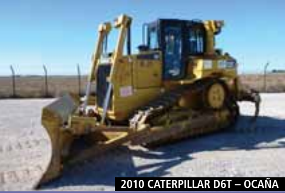
2010 CATERPILLAR D6T – OCAÑA

» Para listas actualizadas del equipo, por favor, visite nuestra página web en: www.rbauction.es