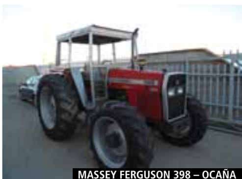
MASSEY FERGUSON 398 – OCAÑA