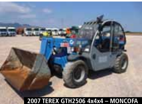
2007 TEREX GTH2506 4x4 - MONCOFA