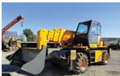
DIECI PEGASUS 30.16 4x4x4 – OCAÑA