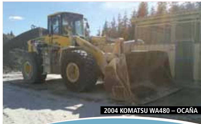
2004 KOMATSU WA480 – OCAÑA