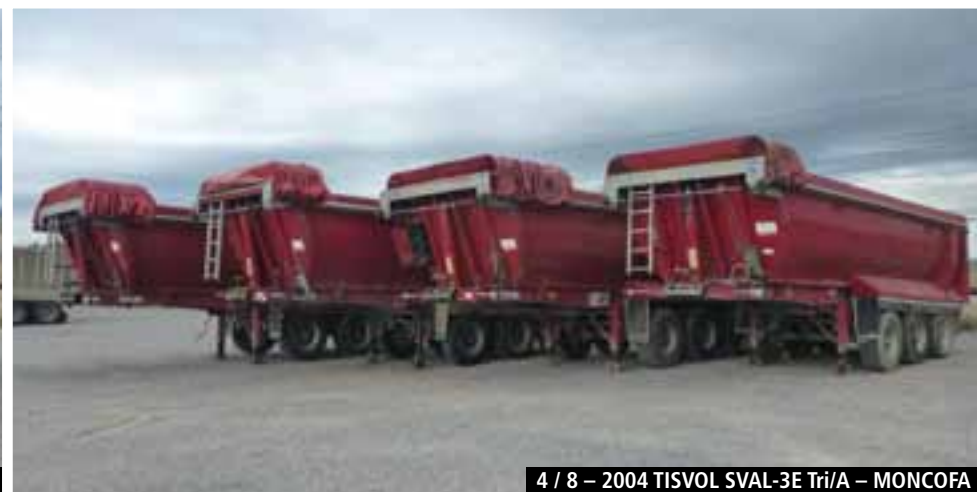
4 / 8 – 2004 TISVOL SVAL-3E Tri/A – MONCOFA