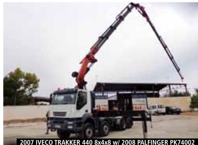
2007 IVECO TRAKKER 440 8x4x8 w/ 2008 PALFINGER PK74002