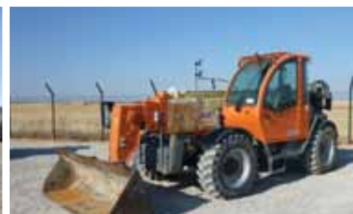
2007 JLG 4017 4x4x4 – OCAÑA

» OBTENGA LISTAS ACTUALIZADAS EN www.rbauction.es