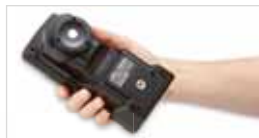
El CL-500A pesa sólo 350 g., por lo que es fácil de manejar durante largas jornadas

El CL-500A puede medir CRI, temperatura de color, la curva espectral de irradiancia y el pico de longitud de onda en su propia pantalla. No es necesaria su conexión a ordenador.