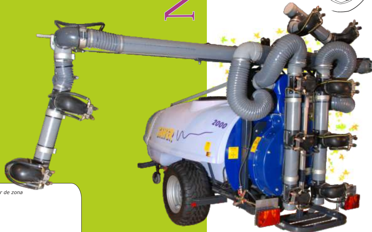
distribuidor de zona