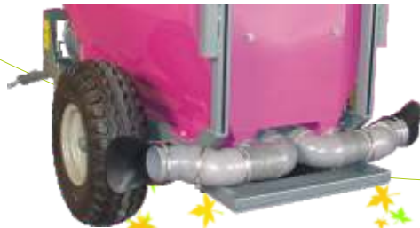
Detalle opcional salidas inferiores