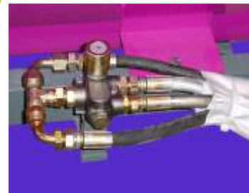
Mando hidráulico al tractor