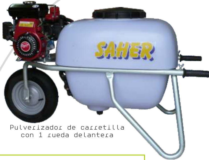
Pulverizador de carretilla con 1 rueda delantera