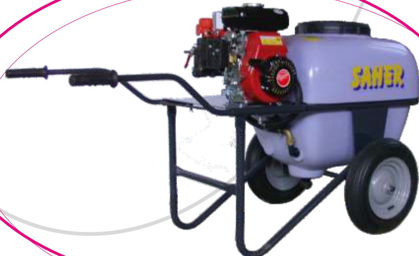
Pulverizador de carretilla con 2 ruedas centrales