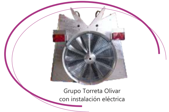
Grupo Torreta Olivar con instalación eléctrica