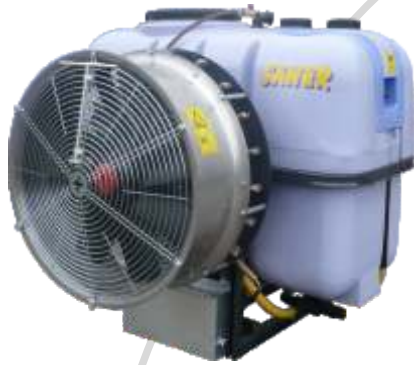
Mod. Grupo correas