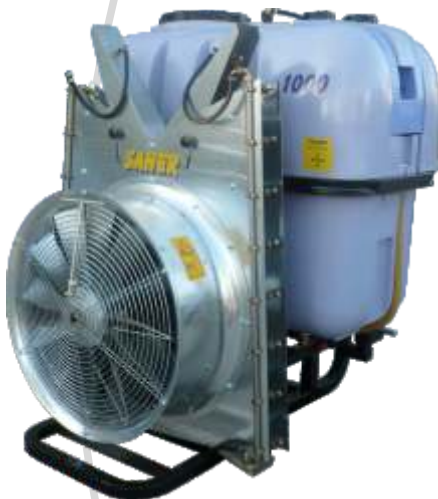
Mod. Multiplicador grupo Torreta