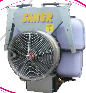
Atomizador 500 lts. grupo ventilador 700 mm. con alerones viña