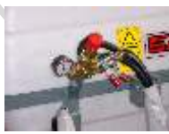
Mando al tractor