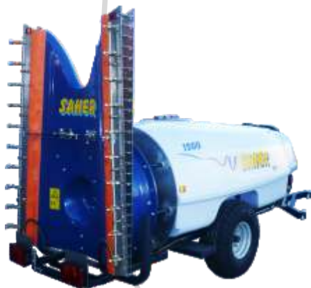
Mod. Inverter Torreta