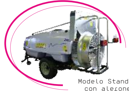
Modelo Standard con alerones