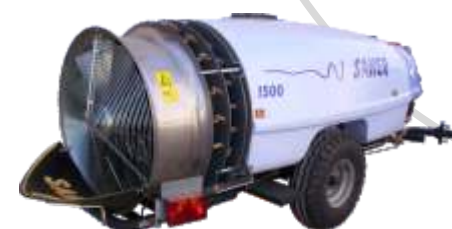
Mod. 3 salidas