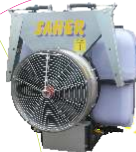
Modelo Grupo correas con alerones