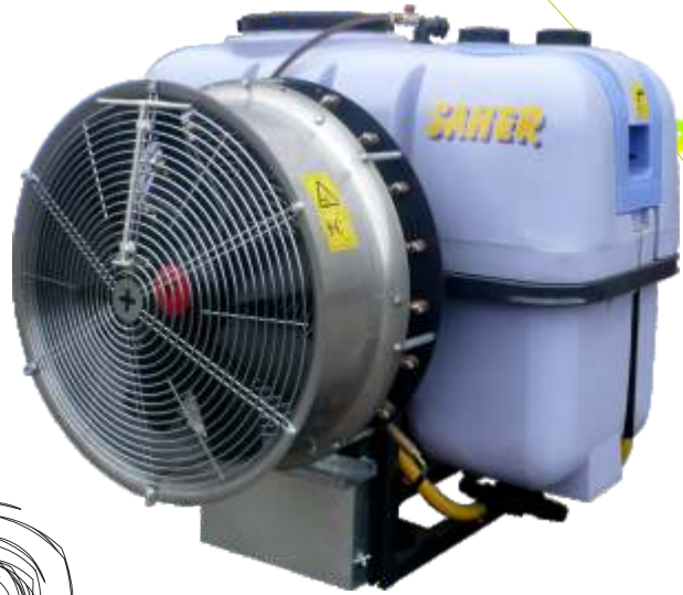
Mod. Grupo correas

Los atomizadores SAHER disponen de un ventilador de 8 aspas regulables que pueden modificar el caudal de aire según las necesidades del cultivo, impulsado por correas o por un multiplicador de 2 velocidades y desconectado. El aire resultante es canalizado mediante 1 cono central de poliéster que equilibra y refuerza su dirección. Un arco de pulverizadores de latón en inoxidable esparcen el producto fitosanitario de forma proporcional y adaptable al cultivo. Recomendado para cultivos de viña y arbóreos.