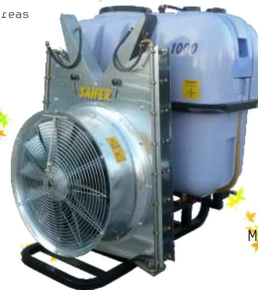
Mod. Multiplicador grupo Torreta