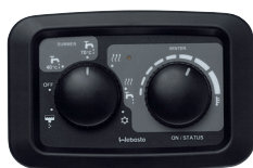
Panel de control manual (estándar)

El panel de control manual permite seleccionar varios modos de calefacción para el calentamiento del agua y el aire doméstico, el drenaje de la caldera y la función anticongelante.