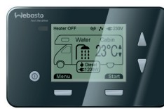
El panel de control digital

El panel de control manual permite seleccionar varios modos de calefacción para el calentamiento del agua y el aire doméstico, el drenaje de la caldera y la función anticongelante.