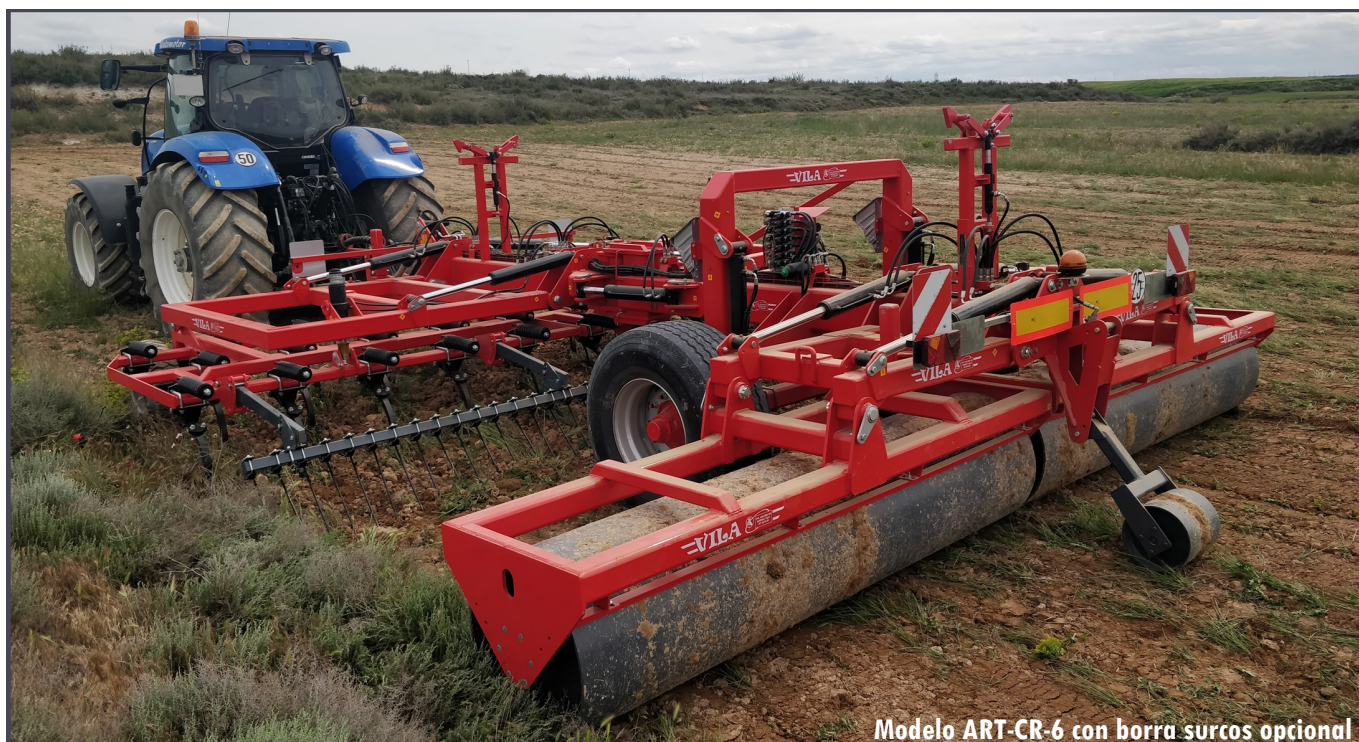
Modelo ART-CR-6 con borra surcos opcional