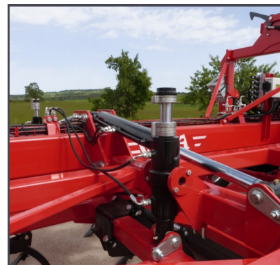
Cilindro con tope