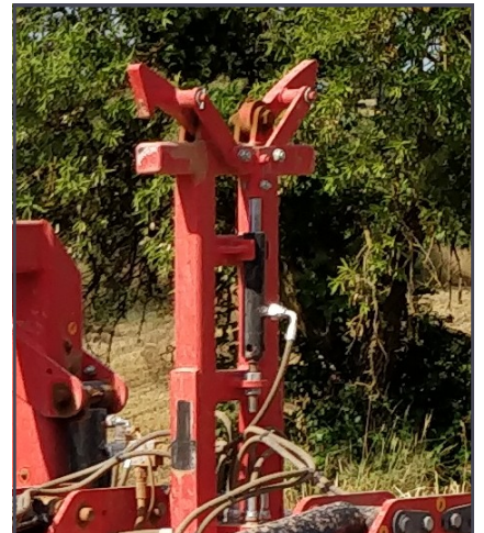
Cierre hidráulico de seguridad