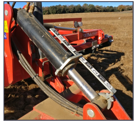
Control de profundidad