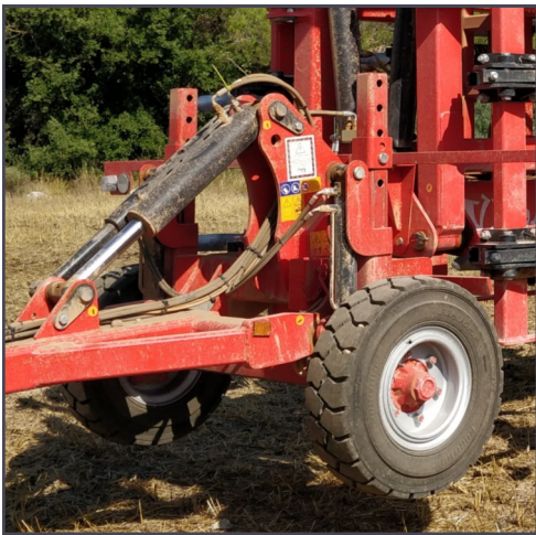
Ruedas de control centrales opcionales