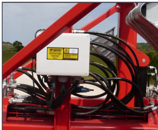
Equipo válvulas línea sensora vía radio opcional