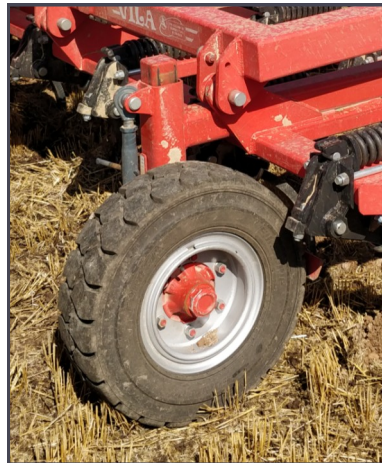
Ruedas de control en los cultivadores opcionales