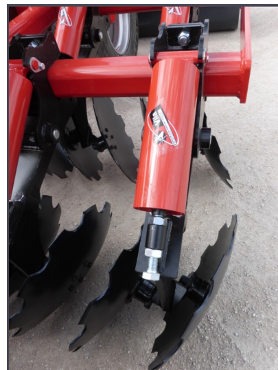
Soporte de la grada rápida.