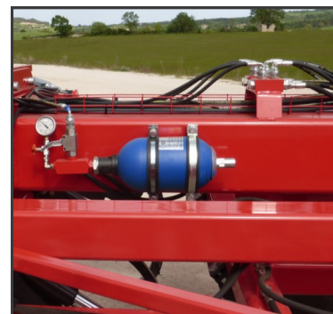
Calderín de hidrógeno para el disparo de los brazos chisel.