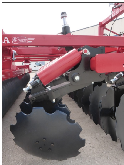
Vista del soporte de la grada rápida.