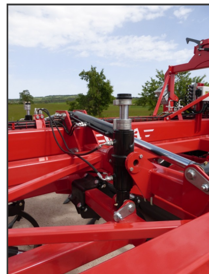
Cilindro con tope para la nivelación de la grada rápida y el chisel.