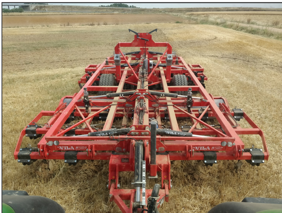
Vista superior del equipo hidráulico e instalación.