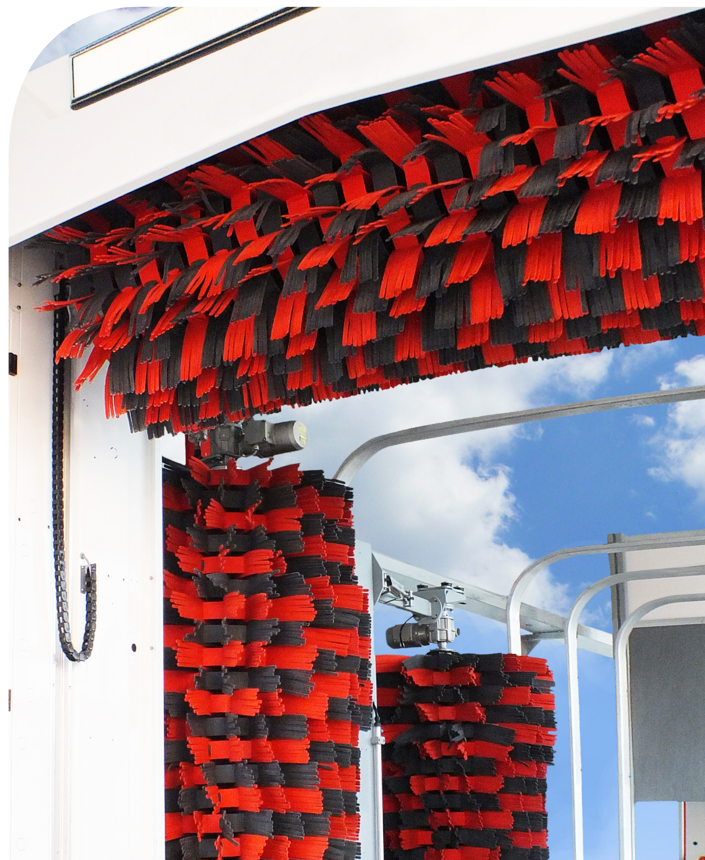
ISTOBAL T'WASH10 A la vanguardia del lavado