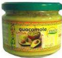
1 caja = 6 frascos de 300 grs. REF. LV002