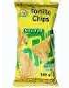
Ref. LV200 20 paq. x 200 grs