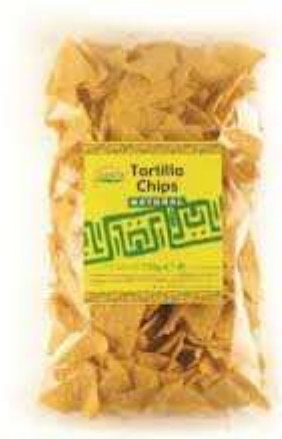
Ref. LV454 12 paq. x 454 grs