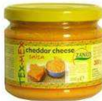
1 caja = 6 frascos de 300 grs. REF. LV003