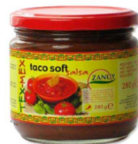
1 caja = 6 frascos de 300 grs. REF. LV004