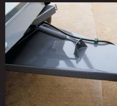
Ballesta de lanza