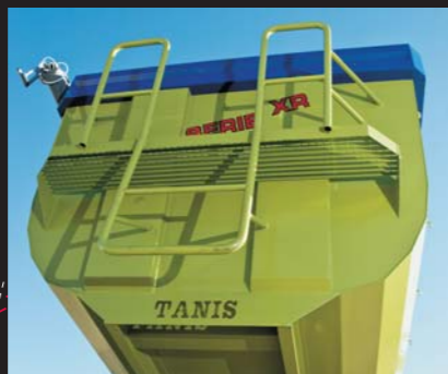
Puerta hidráulica corredera