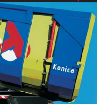
Lateral doble costilla

Es el modelo de remolque agrícola más versátil. Con una personalización dependiendo de sus necesidades laborales. Dispone de una amplia gama de detalles o accesorios, tamaños y colores para poder personalizar el remolque a su gusto. Todo ello con unos materiales de primera calidad, que hace al remolque a la vez de útil, duradero.