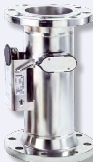
Caudalímetros ULTRAFLOW® q_p 60 a 1000 m^3/h