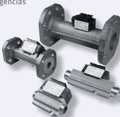
Caudalímetros ULTRAFLOW® 54 q_p 0,6 a 40 m^3/h