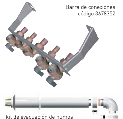
kit de evacuación de humos código 3318001