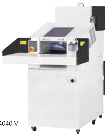
HSM SP 4040 V