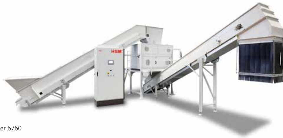
HSM DuoShredder 5750