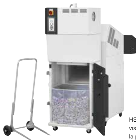
HSM SP 4040 V: vista trasera con la puerta abierta