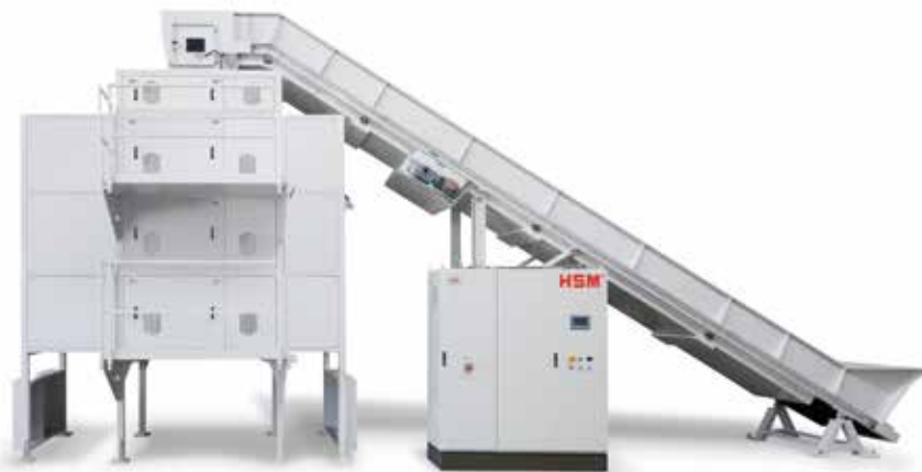
HSM TriShredder 6060