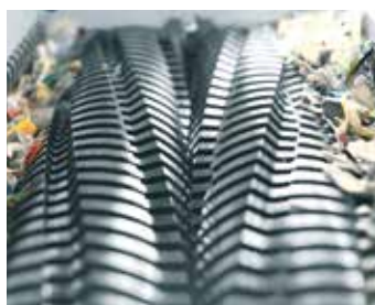
2.º nivel del mecanismo de corte: posttriturador