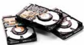
Destrucción de discos duros

Muchos de estos soportes de datos se desechan sin cuidado: sus datos se borran con procesos insuficientes y se venden en mercadillos y on-line. Actuando así se deja la puerta abierta de par en par al uso indebido de sus datos: en un abrir y cerrar de ojos podrán recuperarse datos confidenciales como contraseñas y datos de cuentas bancarias. Usted puede evitar estos peligros! HSM ofrece a nivel mundial el mayor rango de destructoras de documentos y destructoras de soportes de datos en los diferentes ámbitos de aplicación.