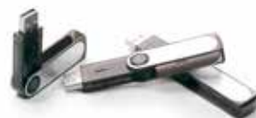
Destrucción de sticks USB