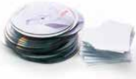
Destrucción de CDs, DVDs, Blu Rays y tarjetas de crédito y débito