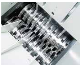
1.º nivel del mecanismo de corte: pretriturador