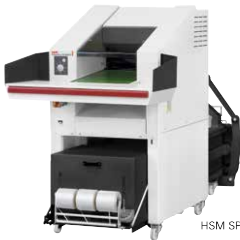
HSM SP 5088