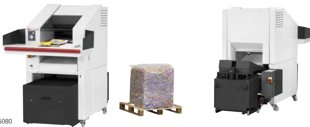
HSM SP 5080