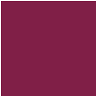
GRANATE Ral 3005 6703