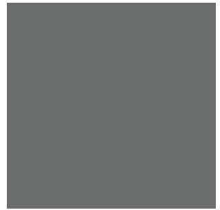
GRIS OSC. Ral 7037 6704