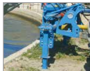
Pies de soporte ajustables en altura hidráulicamente (accesorios)