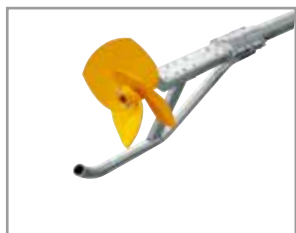
Pie de apoyo de hélice-largo