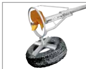
Anillo de protección con fijación de neumático(sin neumático)