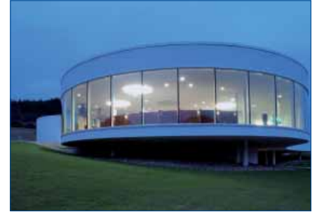
Base de datos de imágenes de GEZE | GEZE Base de datos de imagens