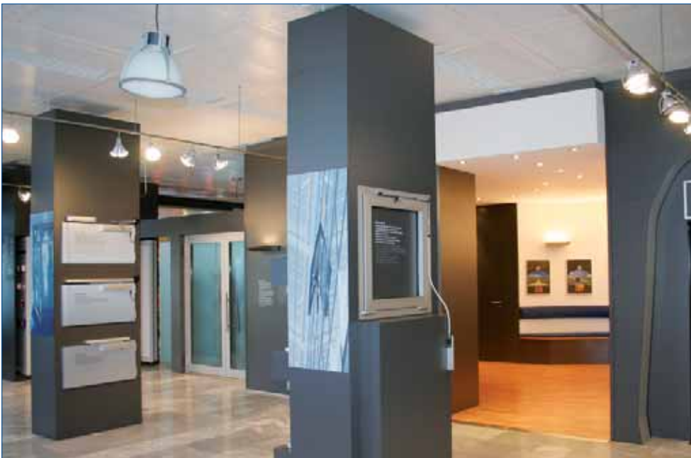
Sala de exposiciones GEZE, sede principal Leonberg