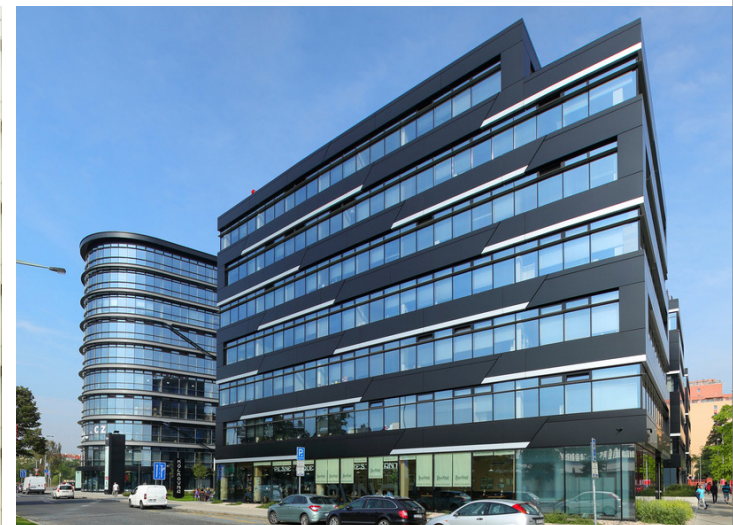
HUNGRÍA BUDAPEST, VÁCI 33 - STOPRAY VISION-61T - LEED SILVER