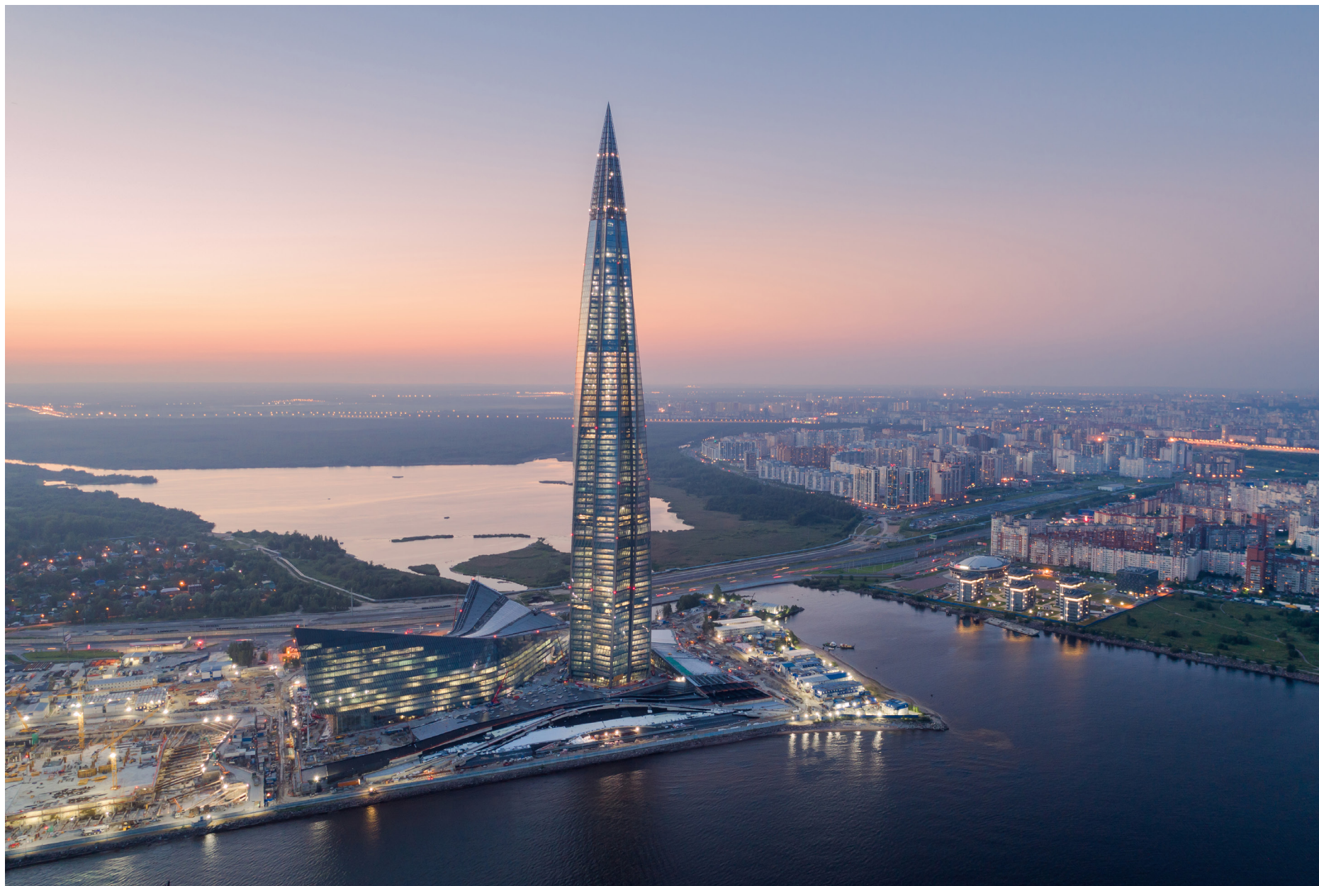
RUSIA SAN PETERSBURGO, LAKHTA CENTRE - ENERGY 72/38, IPASOL BRIGHT WHITE SOBRE CLEARVISION Y PLANIBEL LINEA AZZURRA - TONY KETTLE AND GORPROJECT CICS - LEED PLATINUM