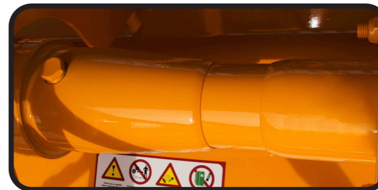
▶ Rueda libre en la manga