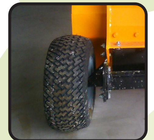
▶ Ruedas fijas S/C