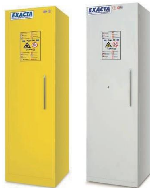
K89601 - K89601B

Los elementos utilizados permiten un excelente aislamiento y consiguen un bajo peso del conjunto.