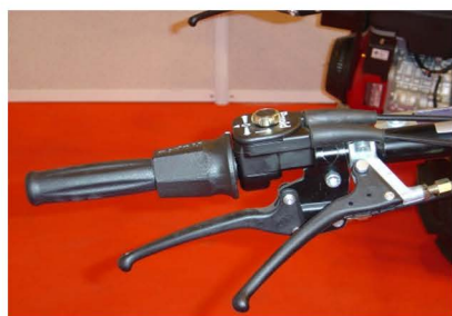
Control hidrostático Rapid