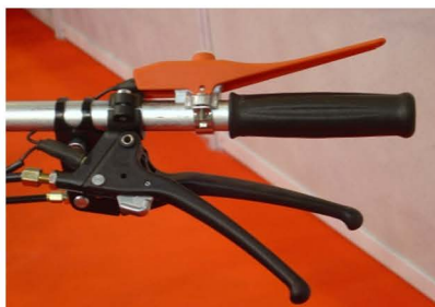
Sistema de giro por manetas