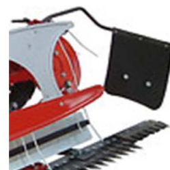
Tope de hierba