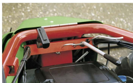
Dos velocidades de toma de fuerza