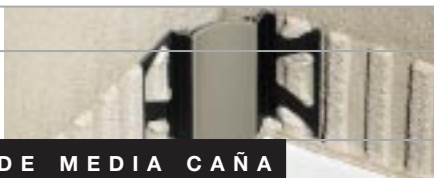
PERFIL DE MEDIA CAÑA