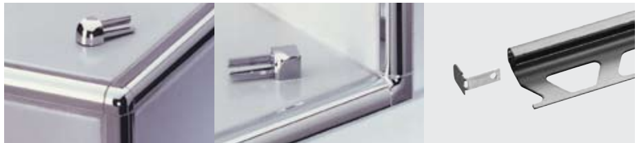
Schlüter®-RONDEC Esquinas exteriores e interiores

(Empalme para perfiles de acero inoxidable)