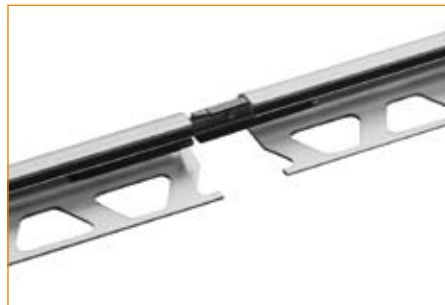
Schlüter®-RONDEC-AV (Empalme para perfiles de aluminio)

Debe evitarse el contacto con otros metales, como por ejemplo el acero normal, ya que ello puede conllevar la contaminación con óxido ajeno. Lo mismo rige para herramientas como llanas o lana de acero, que se emplean para la eliminación de restos de mortero.