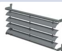
BS 20 MARCOS PRE-ENSAMBLADOS