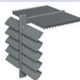
BS 100 LAMA FIJA