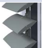
BS 100 FIJACIÓN LAMA