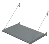
BS 100 MARCOS PRE-ENSAMBLADOS