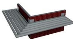
BS 30 MARCOS PRE-ENSAMBLADOS