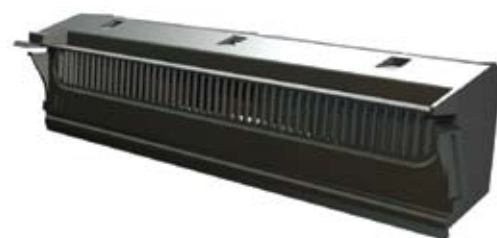
rejilla de ventilación

El sistema se integra fácilmente en los diferentes sistemas de Reynaers.