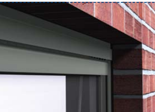
detalle vista exterior

Los perfiles de ventilación pueden colocarse en diferentes configuraciones, ofreciendo mayor versatilidad para instaladores y arquitectos.