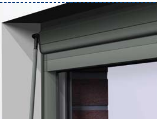
detalle vista interior