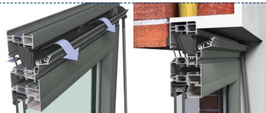
flujo de aire