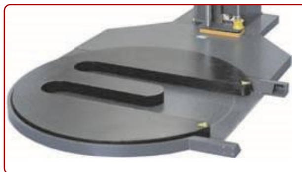
Modelo 600TP-L: entrada lateral de la carga