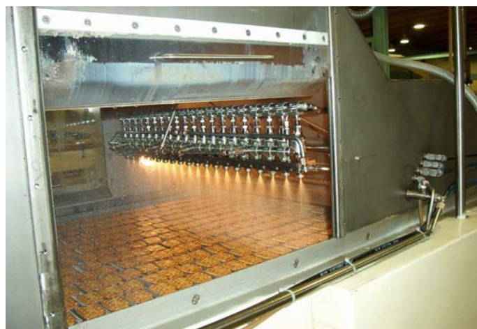
Ramba de pulverización de aceite de palma en crackers

Opciones: control de nivel, sistema de auto-llenado de tanque, doble tanque, agitador.