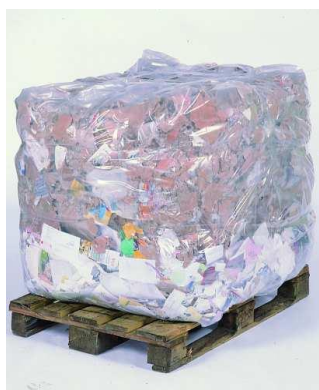
PAPEL Y CARTON > 450 kg