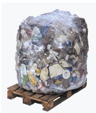
RESIDUO GENERAL >1000 kg