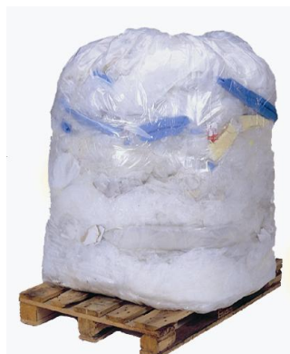
PLASTICO >200 kg