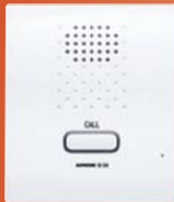
NI-BA Estación secundaria, montaje en superficie