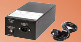
IS-PU-S Fuente de alimentación