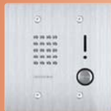
NI-JA Estación secundaria, montaje empotrado