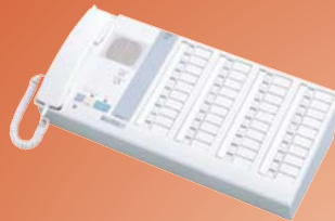
NIM-40B Estación principal, 40 llamadas