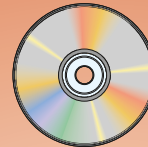
NI-SOFT Software para el registro de llamadas Accesorio: cable RS-232