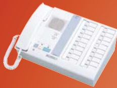
NIM-20B Estación principal, 20 llamadas