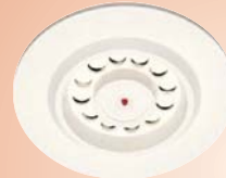
NI-LB Altavoz de techo