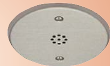
NI-SB Micrófono de techo