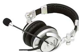
Microauriculares (opción) SHM7410U

Pupitre de intérprete con control digital para 6 canales, con pantalla LCD para configuración y control de los canales, micrófono flexo, altavoz y conexión para microauriculares.